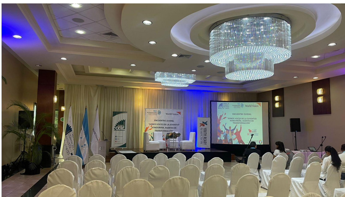
Ilustración 4: Evento Encuentro Juvenil