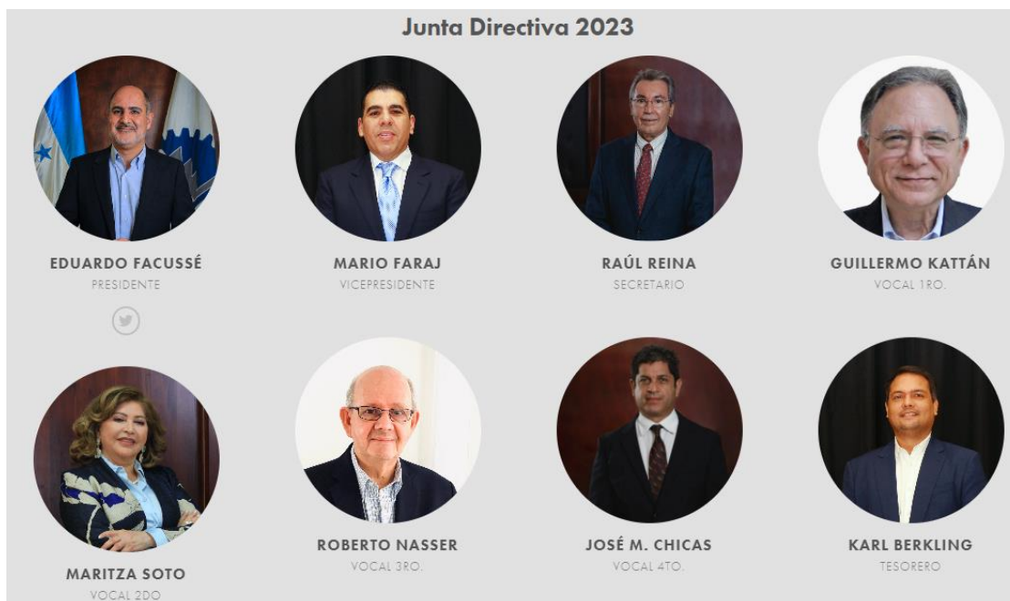
Ilustración 2: Junta directiva