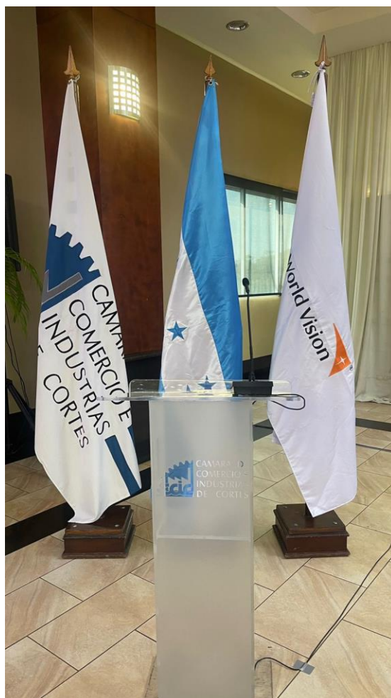
Ilustración 6: Fotografía evento CCIC