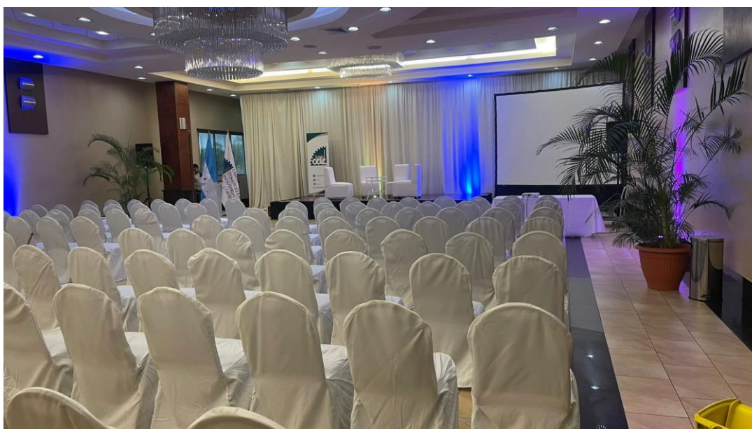
Ilustración 5: Evento programa MISE