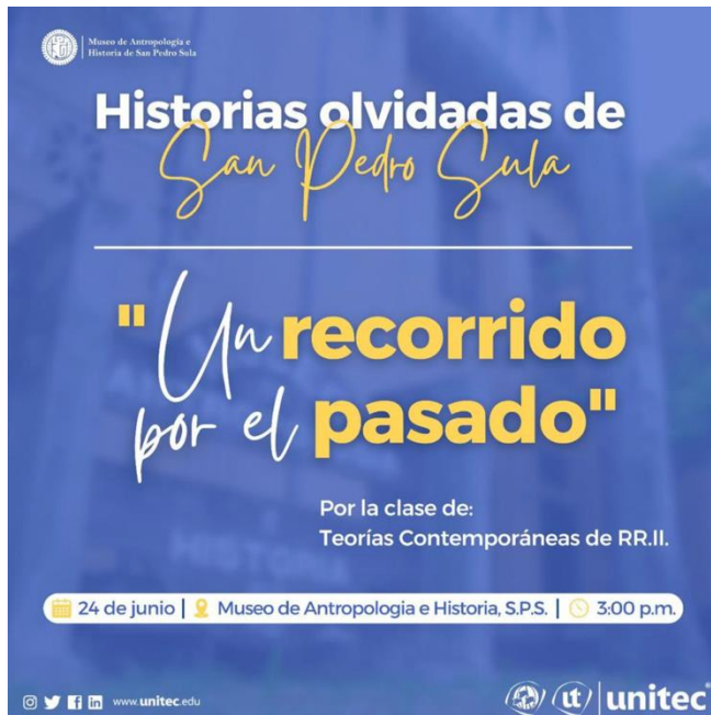
Ilustración 3 Realización del evento