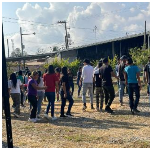
Anexo 8. Manifestando desarrollo de habilidades blandas