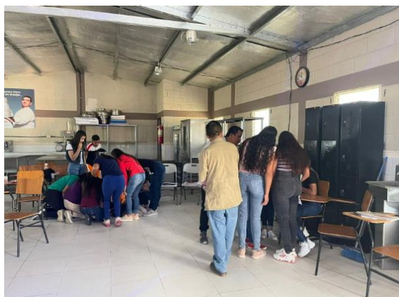
Anexo 9 y 10. Donación de sillas para el taller de salón de belleza y barbería de INFOP