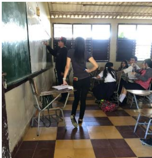
Anexo 4. Entrega de kits escolares al CEB Dr. Presentación Centeno