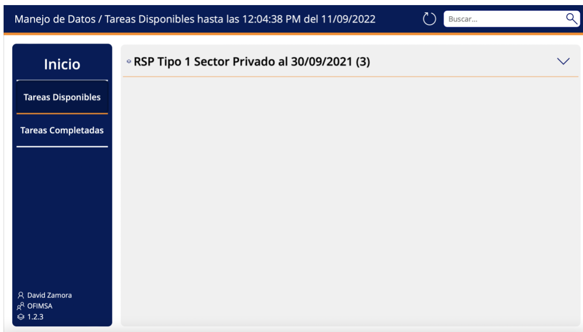
Figura 3 RSO Tareas Disponibles