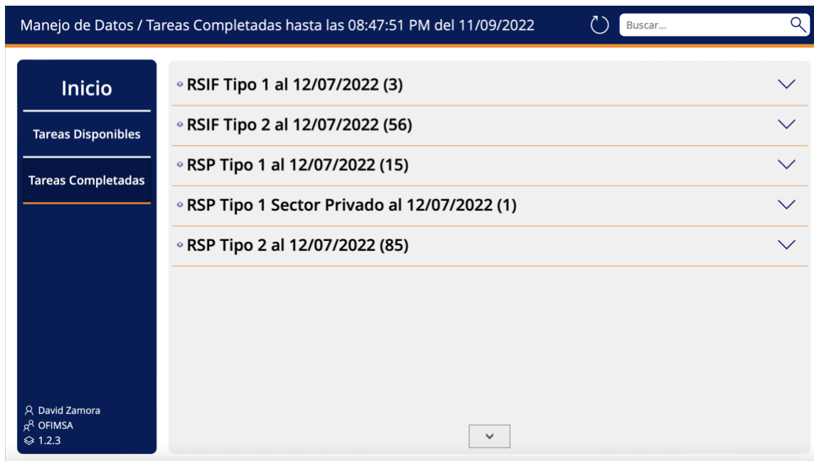
Figura 4 Tareas Completadas RSO