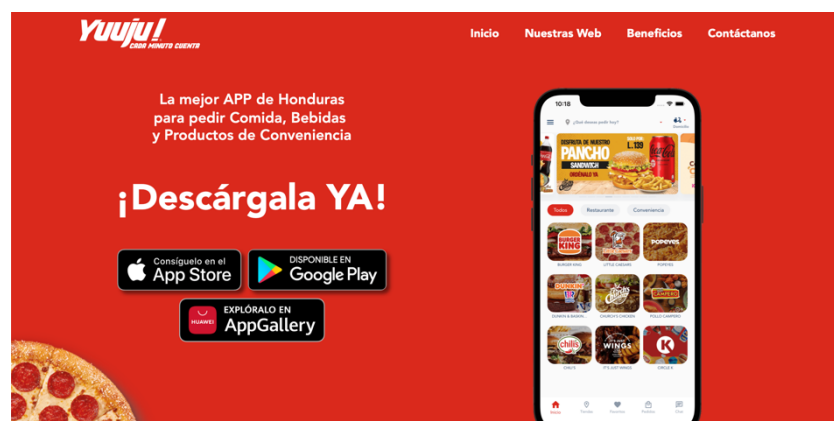
Ilustración 6. Publicación en Redes Sociales

Con esta campaña se espera llegar a un segmento de mercado más amplio ya que las redes sociales se han vuelto una herramienta esencial para dar a conocer a nuevos emprendimientos es bastante efectiva si la sabemos aprovechar de la mejor manera. Se espera realizar publicaciones en las horas más visualizadas en las plataformas de Instagram, Facebook y Tik Tok para ir dando a conocer la aplicación y que las personas se vayan familiarizando con la app así mismo se pretende lograr que la descarguen para generar mayor transacciones.