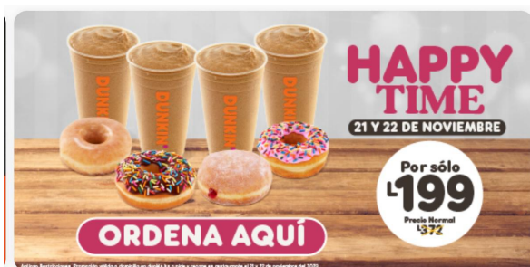
Anexo 1. Promoción De Dunkin Donuts