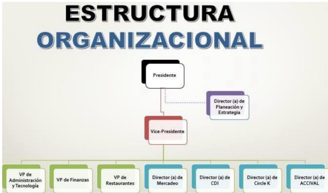
Ilustración 1. Estructura organizacional