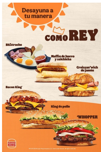
Ilustración 2. Campaña De Desayunos

Es un proceso algo tardado ya que para poder lanzar la campaña tienen que analizar su público meta y si será factible lanzarla ya que se toma bastante en consideración al cliente. Esta actividad es de mucha importancia ya que constantemente se están lanzando campañas nuevas dependiendo la temporada para llamar la atención de los consumidores.