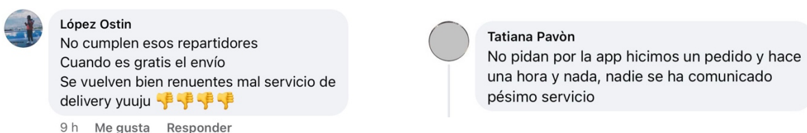
Ilustración 5. Mensaje en las Redes Sociales de Yuuju

En los últimos años, se ha registrado una disminución en las ventas de delivery y pick up en la aplicación de yuuju, lo que emotiva a emprender nuevas estrategias para generar mayor interés en los consumidores. Esta disminución podría ser asociada por los cambios de precios que ha habido en los productos, poca publicidad, tiempo de espera alargados, falta de interacción, entre otros aspectos. En fin, se busca generar nuevas iniciativas para volver a despertar ese interés de compra en el consumidor para el consumo de comidas rápidas. Se pretende implementar nuevas técnicas para que los consumidores conozcan más de la aplicación yuuju y realicen sus pedidos por medio de la aplicación ya que muchas personas no conocen de la app o no saben cómo utilizarla.