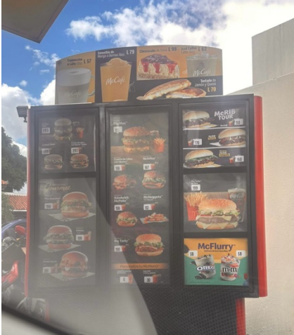
Ilustración 3. Investigar precios de competencia