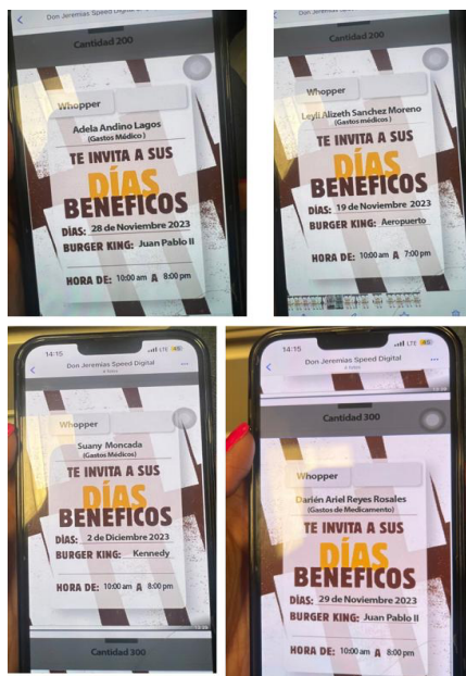
Ilustración 4. Noches Benéficas