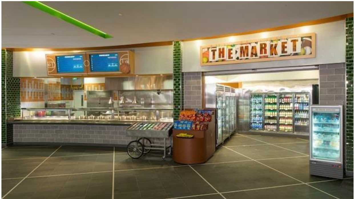
Entrada a la tienda de conveniencia de End Zone Food Court