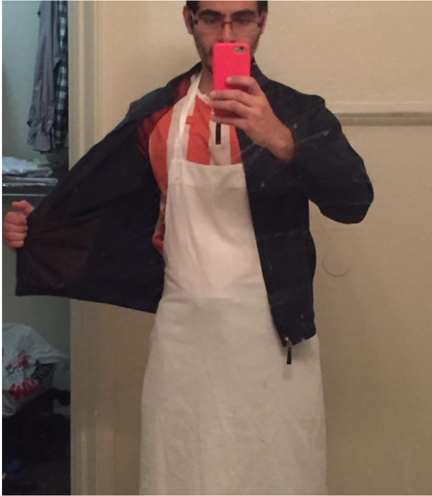
Uniforme de End Zone Food Court