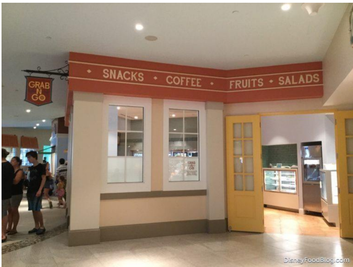
Entrada a la tienda de conveniencia Grab-N-Go