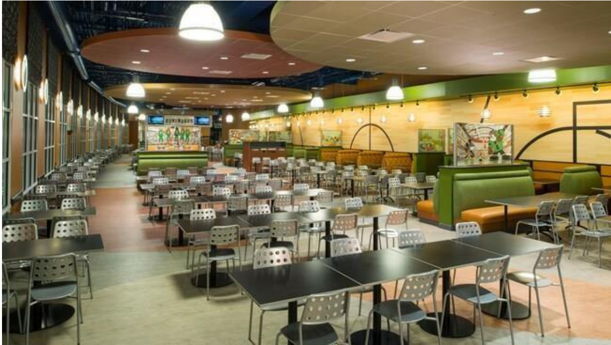
Salón principal de End Zone Food Court