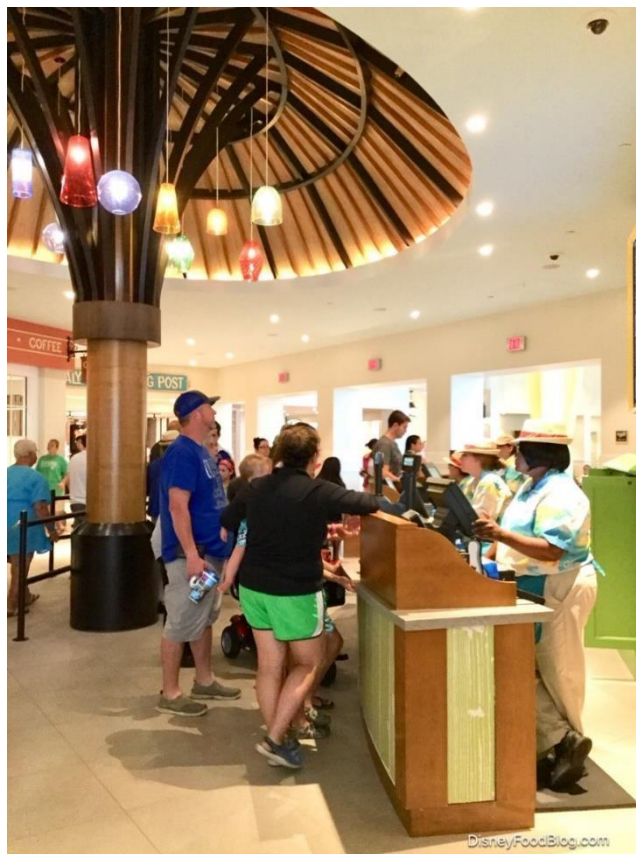
Lobby del Restaurante Centertown Market