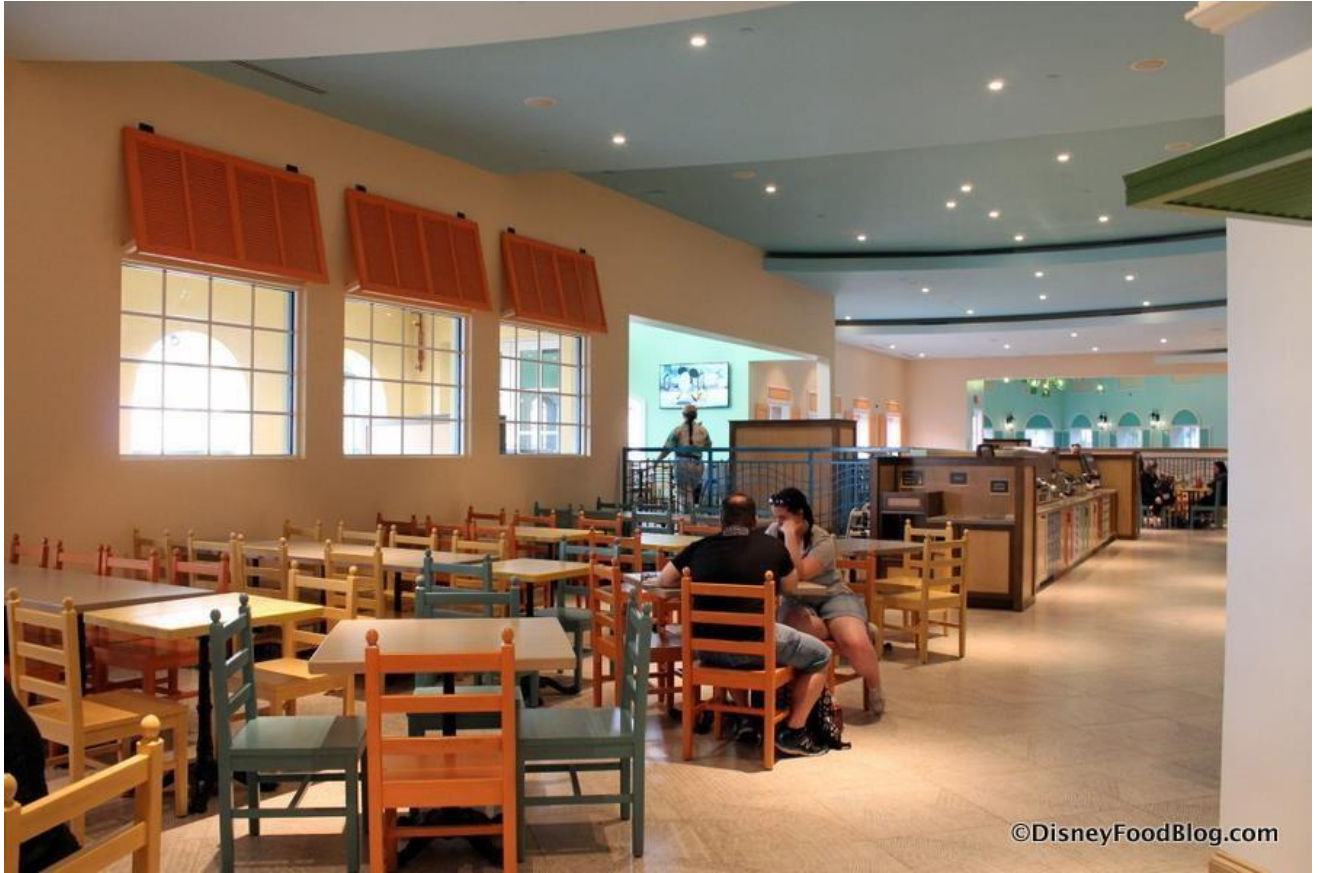
Salón Principal del Restaurante Centertown Market