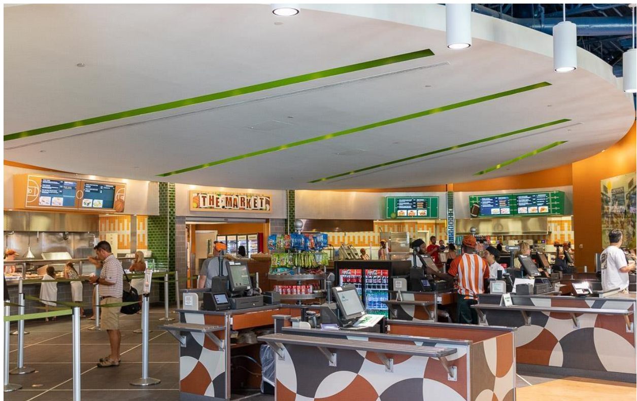
Cajas registradoras de End Zone Food Court