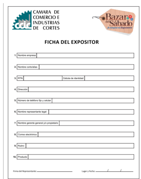
Figura 1. Ficha de inscripción

Se da cuando el emprendedor ya ha respondido a una serie de preguntas y nos ha mostrado imágenes de que su producto es artesanal y/o cien por ciento hondureño. Al comprobarlo se llena una ficha de inscripción de acuerdo al rubro (alimentos, bisutería, artesanías, etc.).