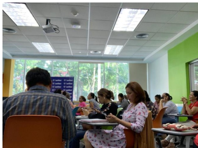
Clase presencial del Diplomado