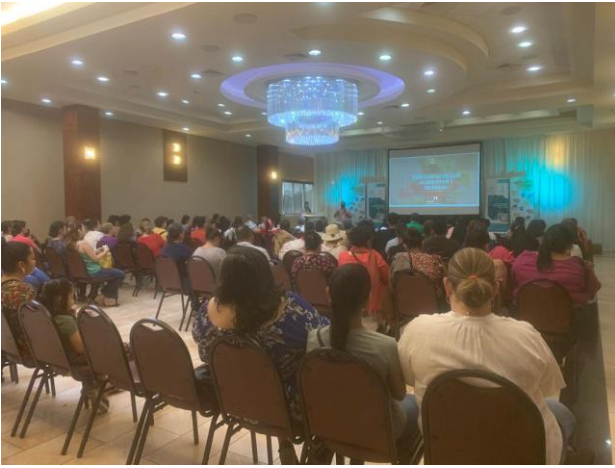
Capacitación por parte del ARSA