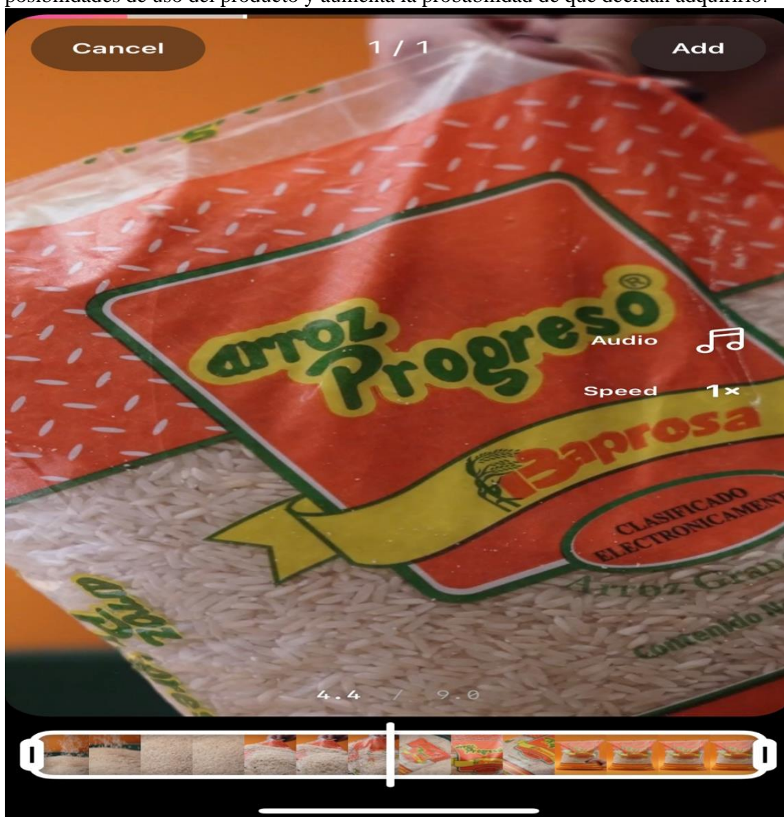
Ilustración 5. Video corto para redes sociales

Además, el video promocional mostró de manera efectiva las cualidades y beneficios del arroz Progreso en presentación de 1.75 kilos, como su calidad, sabor y valor nutricional, así como su versatilidad en la cocina diaria. Esto permite a los consumidores ver la variedad de posibilidades de uso del producto y aumenta la probabilidad de que decidan adquirirlo.