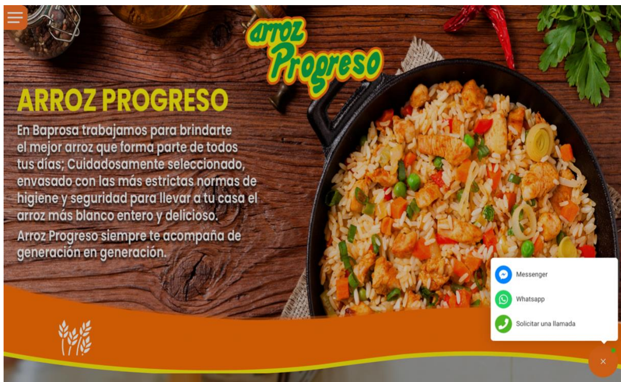
Figuras 4. Pagina web actualizada