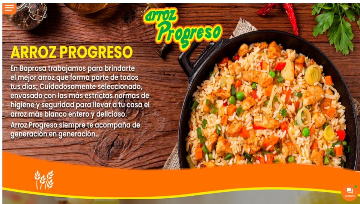
Figura 6. Portada del sitio web