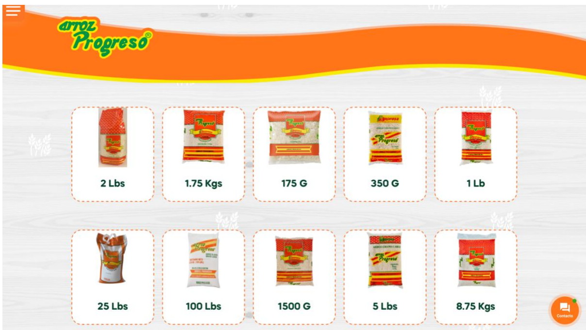
Ilustración 10. Tamaños de Producto