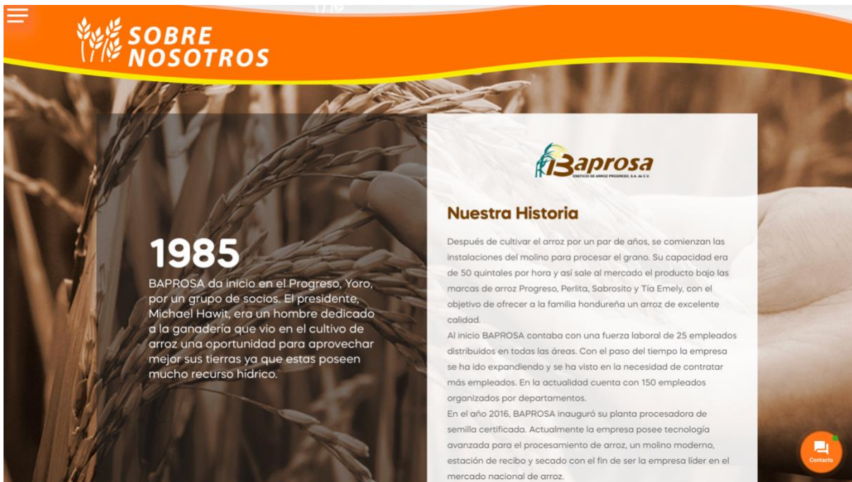
Figura 9. Pagina Sobre Nosotros de Sitio Web