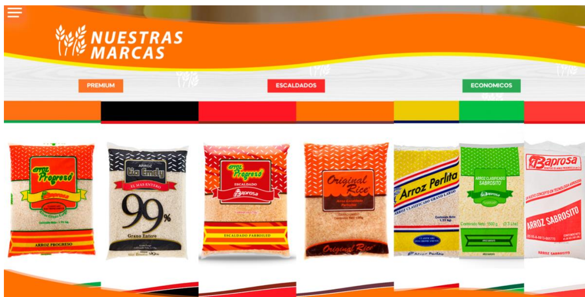
Figura 8. Productos en Sitio Web