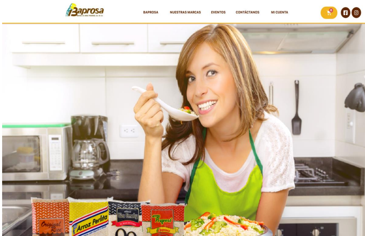
Figuras 3. Sitio Web

La propuesta consiste en crear una nueva página web para Baprosa, ya que la página web anterior estaba obsoleta y no ofrecía una buena experiencia de usuario. La nueva página web se diseñará teniendo en cuenta las necesidades y objetivos de Baprosa, así como su imagen corporativa y su presencia en línea.