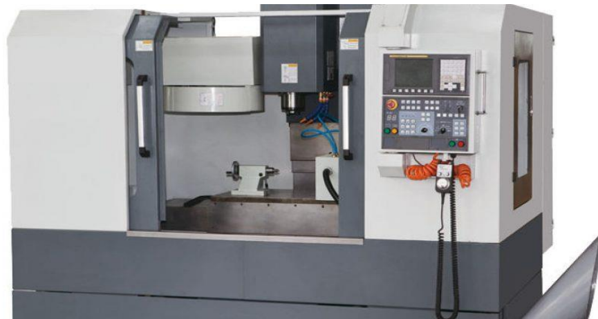
ILUSTRACIÓN 11. FRESADORA CNC INDUSTRIAL

En la ilustración 11 se ve un ejemplo de cómo es una fresadora cnc industrial.