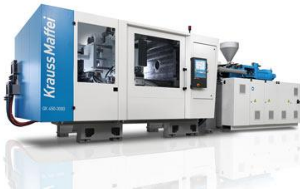
ILUSTRACIÓN 9. INYECTORA DE PLÁSTICO KRAUSS MAFFEI

Un aspecto importante del proceso de inyección de plástico es que no produce contaminación directa al no emitir gases contaminantes ni altos niveles de ruido. En la ilustración 9 se ejemplifica una de las inyectoras dentro de la empresa.