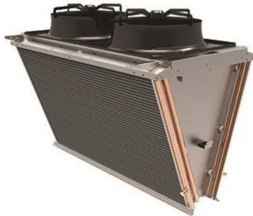
ILUSTRACIÓN 17. CONDENSADORES Y MOTORES DE UN CHILLER

En la ilustración 17 se puede ver los condensadores de un chiller.