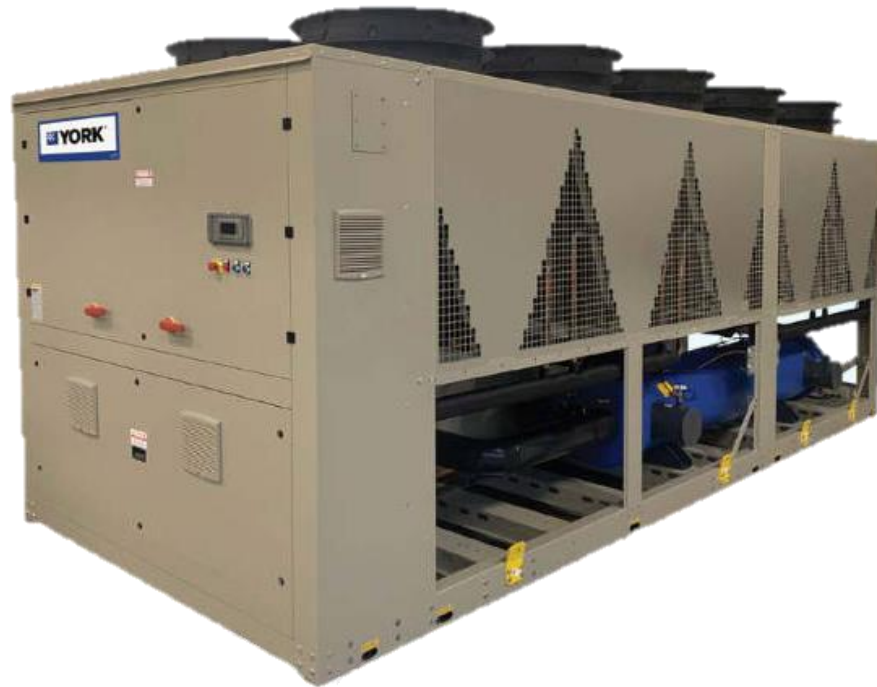
ILUSTRACIÓN 12. CHILLER ENFRIADO POR AIRE