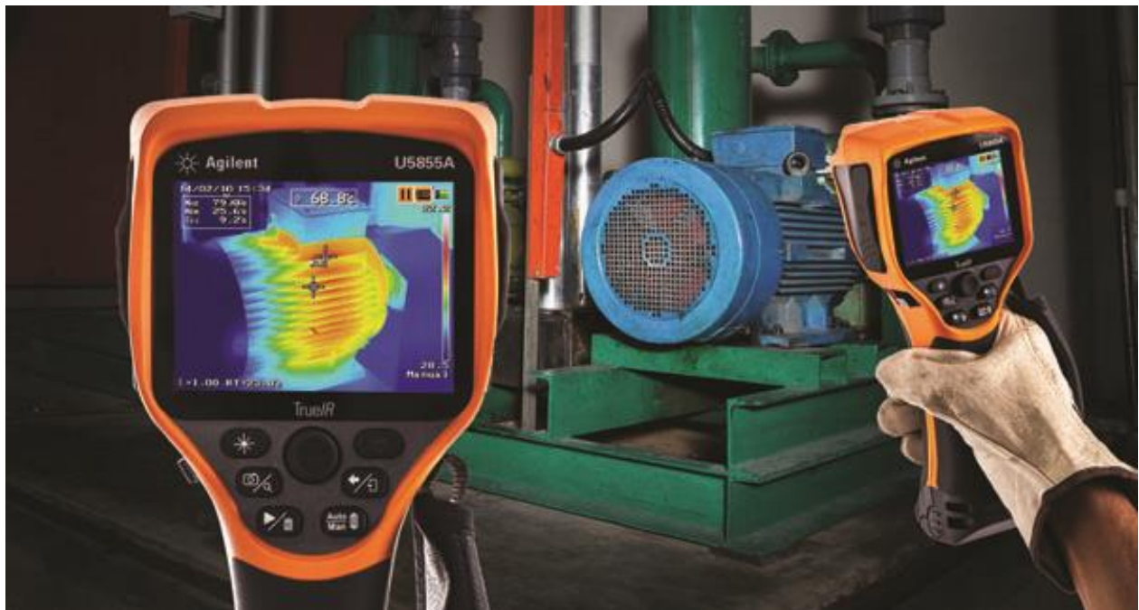
ILUSTRACIÓN 1. TERMOGRAFÍA A UN MOTOR AC

En la ilustración 1 se ve un ejemplo de un mantenimiento predictivo utilizando la técnica de termografía a un motor eléctrico.