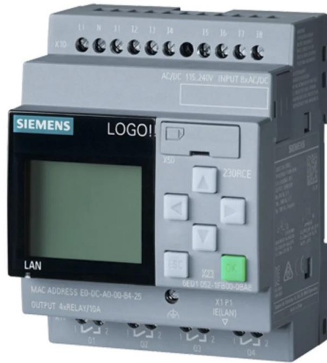
ILUSTRACIÓN 3. PLC LOGO SIEMENS