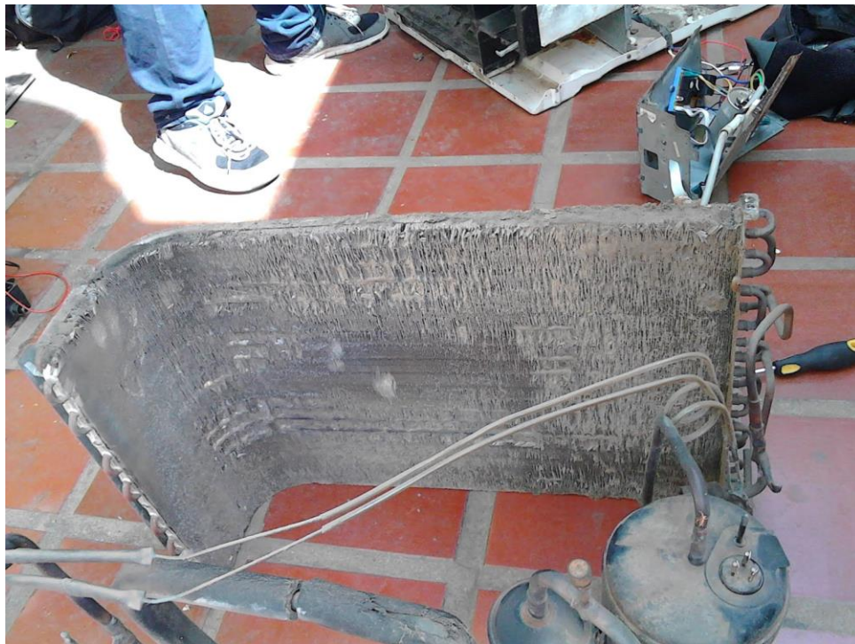
ILUSTRACIÓN 18. CONDENSADOR DE AIRE ACONDICIONADO

En la ilustración 18 se puede ver como se encontraban en algunas veces los condensadores de los aires acondicionados.