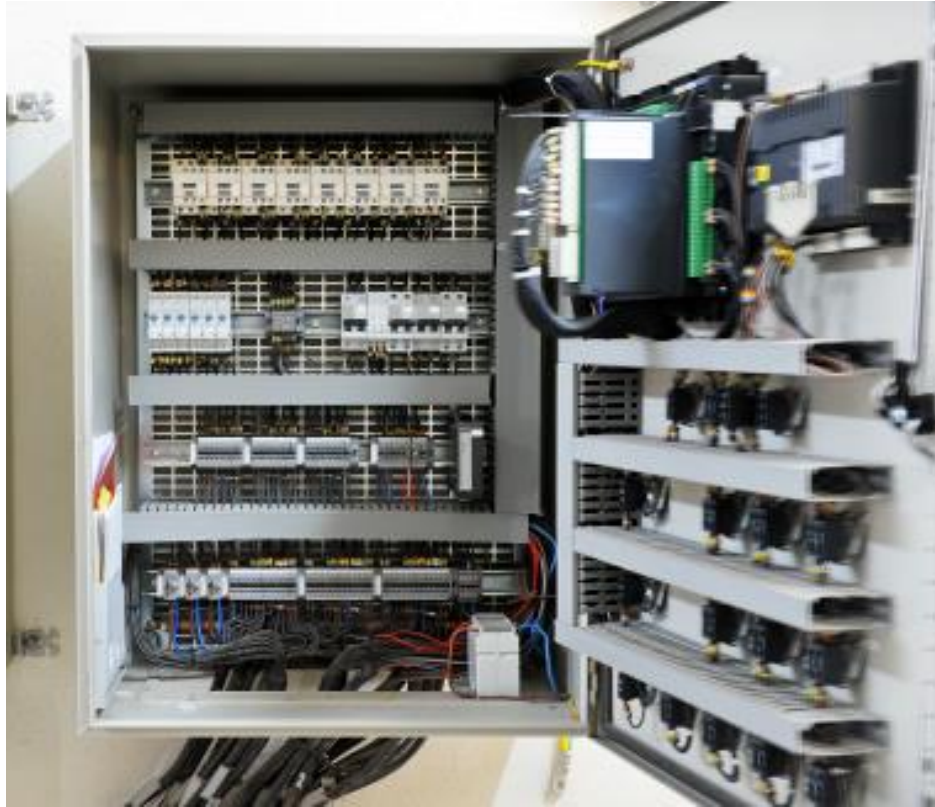
ILUSTRACIÓN 15. PANEL DE CONTROL ELÉCTRICO