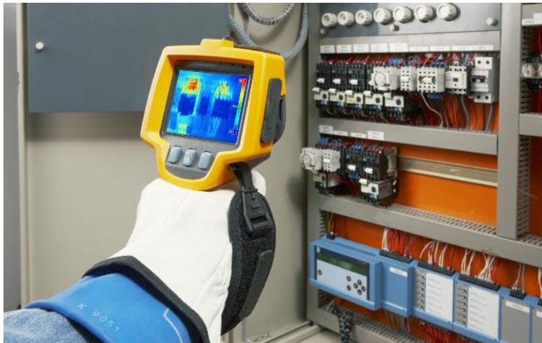
ILUSTRACIÓN 13. TERMOGRAFÍA A PANEL DE CONTROL