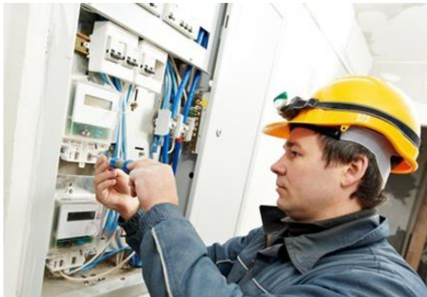
ILUSTRACIÓN 2. MANTENIMIENTO CORRECTIVO

En la ilustración 2 se ve como un técnico está realizando un mantenimiento correctivo a un panel de control.