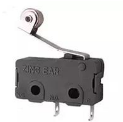
ILUSTRACIÓN 14. MICROSWITCH

En la ilustración 14 se muestra el componente que presentaba problema.