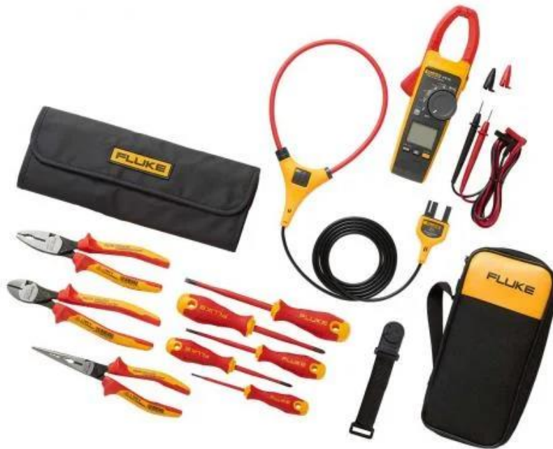
ILUSTRACIÓN 7. KIT DE HERRAMIENTAS AISLADAS DE LA MARCA FLUKE