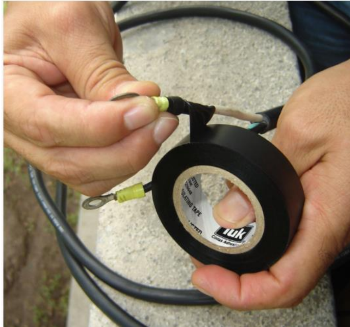
ILUSTRACIÓN 8. USO DE CINTA AISLANTE