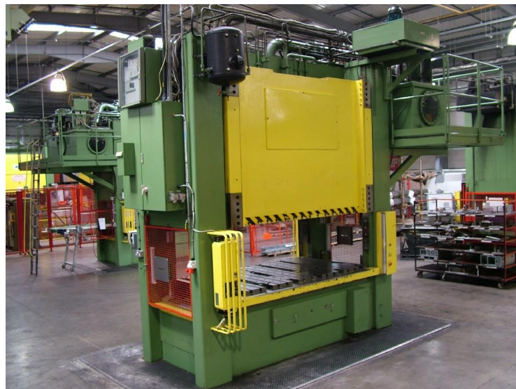
ILUSTRACIÓN 10. PRENSA HIDRÁULICA

En la ilustración 10 se puede apreciar un ejemplo de una prensa hidráulica.