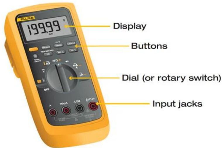
ILUSTRACIÓN 5. MULTÍMETRO DIGITAL

técnicos con necesidades específicas pueden buscar un modelo destinado a tareas particulares. (Fluke, 2022)