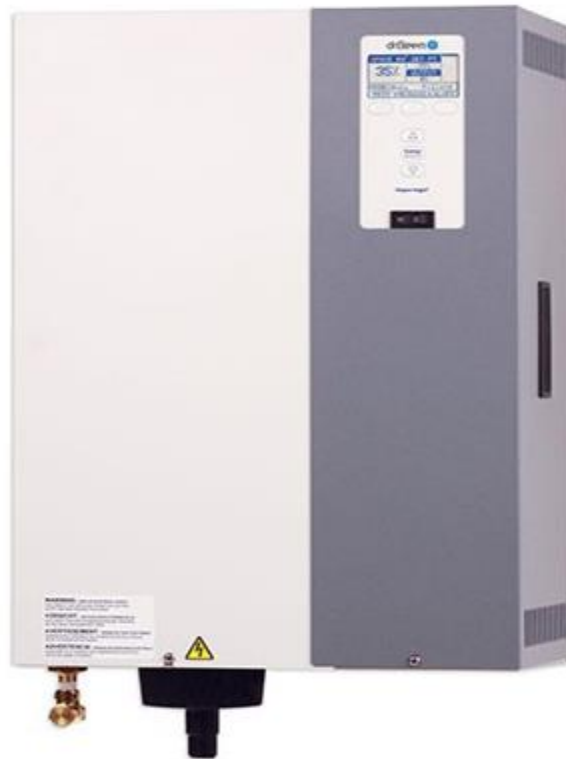
ILUSTRACIÓN 16. HUMIDIFICADOR MARCA DRISTEEM

En la ilustración 16 se puede apreciar el humidificador instalado.