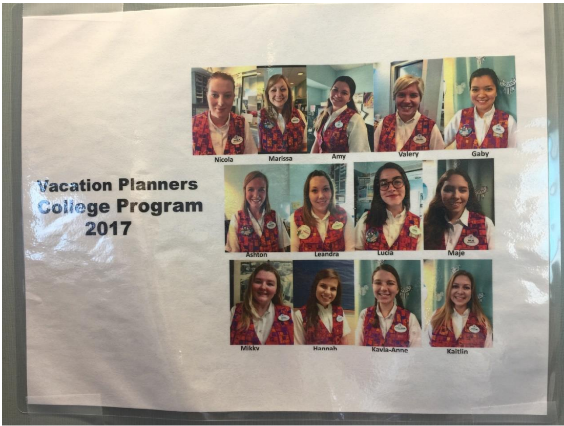
Anexo 4. Fotos de las estudiantes participantes en el College Program.