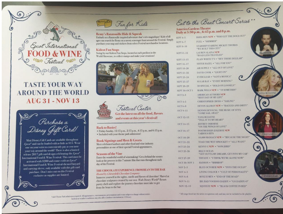
Anexo 3. Cartilla con información del Food & Wine Festival que puede ser mostrada a los guests.