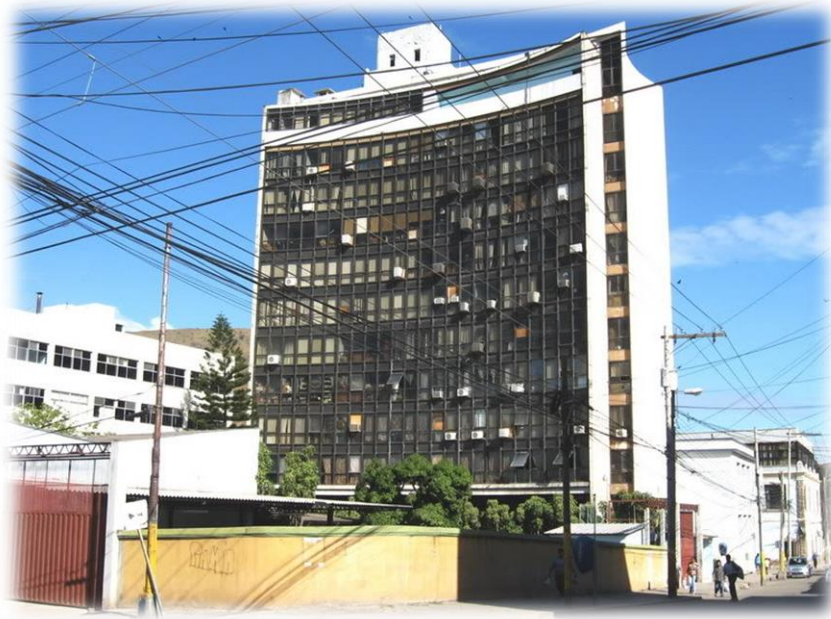
Figura 2 Edificio Administrativo Barrio Abajo, Tegucigalpa, Honduras.