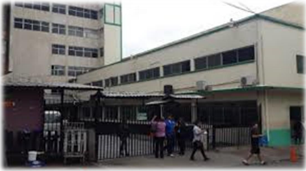
Figura 4. Edificio Periférico I, Barrio abajo, Tegucigalpa Honduras.