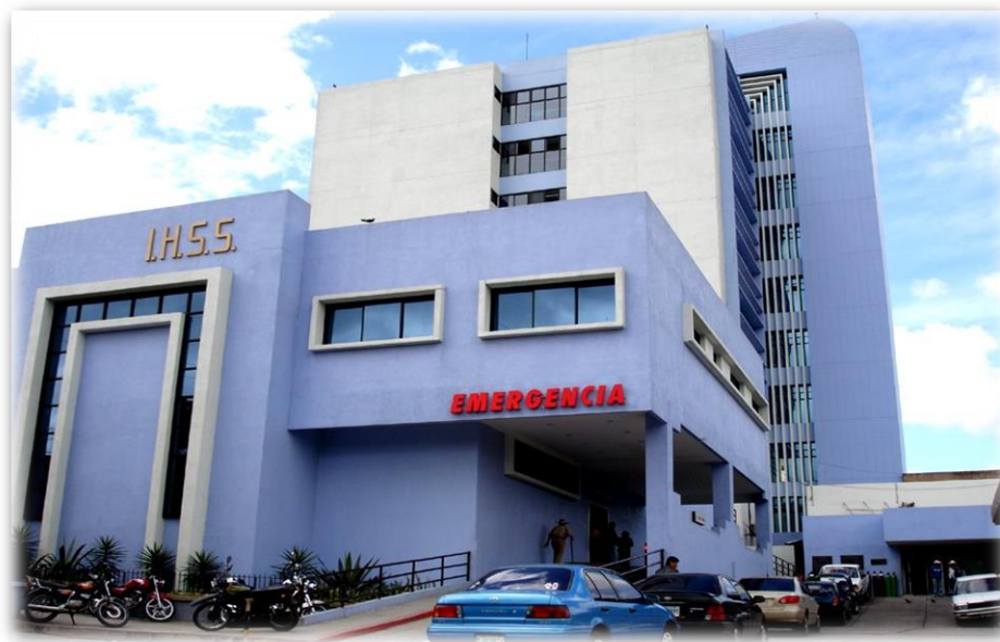
Figura 3. Edificio Barrio la Granja, Tegucigalpa, Honduras.