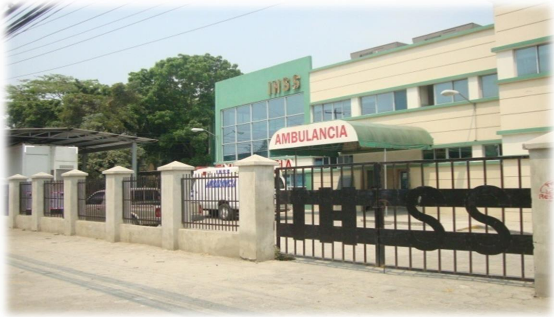
Figura 5. Edificio Hospital Regional, San Pedro Sula, Honduras.