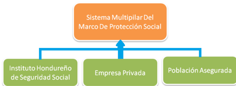
Figura 10 : Variables de investigación

En la presente sección se detallan las variables dependientes e independientes con la finalidad de tener un entendimiento del funcionamiento y la relación que existe entre estas, El sistema multipilar como variable dependiente, La Empresa, El Instituto Hondureño de Seguridad Social, La población asegurada. Como variable independiente ya que son de relevancia para la investigación.