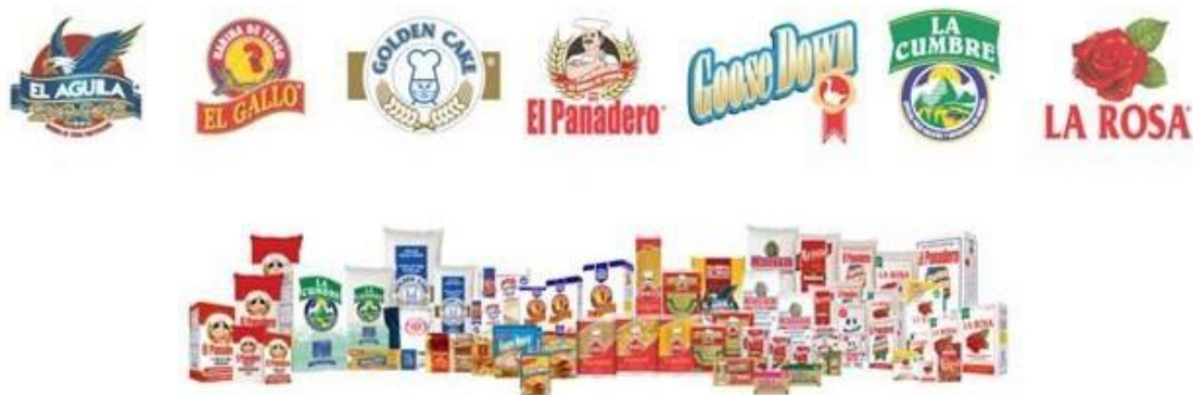
Ilustración 1: Principales Productos del Molino Harinero Sula, S.A.