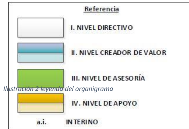
Ilustración 2 leyenda del organigrama