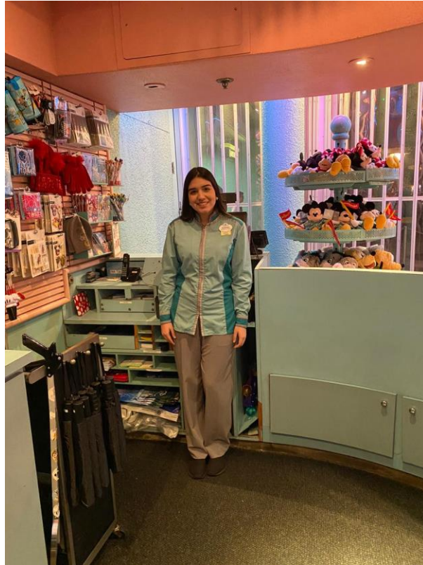
Anexo 3.Tienda Movieland