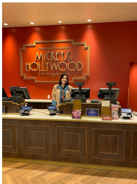
Anexo 2. Tienda Mickey's of Hollywood