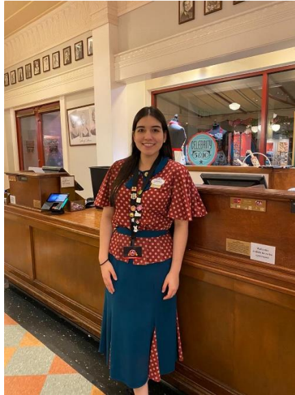
Anexo 1. Tienda 5&10 Celebrity