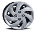
RING 14" * COPAS DE LUJO