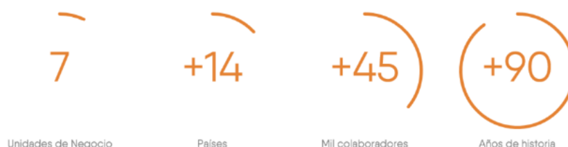
Figura 1. Trayectoria CMI

En la Figura 1 podemos observar el crecimiento que ha tenido la corporación durante sus años de existencia.