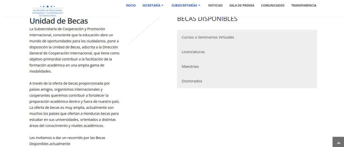
Ilustración 2. Espacio de la Unidad de Becas en la página web actualmente.