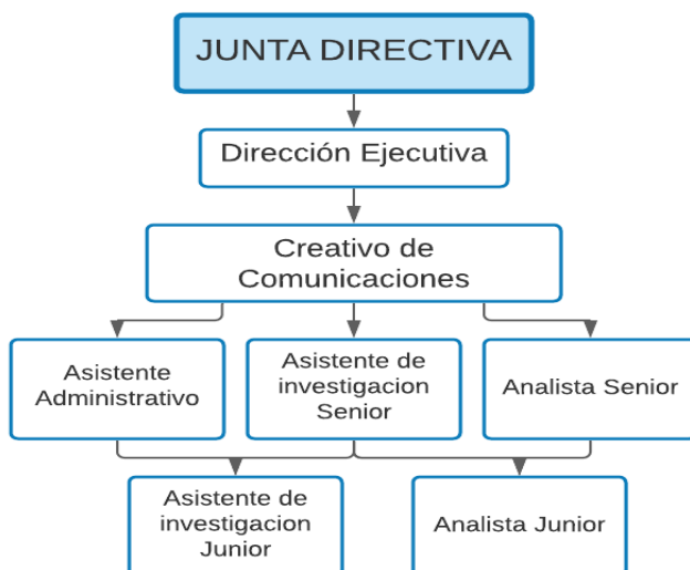
Tabla 1. Organigrama Fundación Eléutera