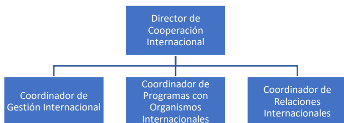
Figura 2. Propuesta de Estructura de la Unidad de Cooperación Internacional