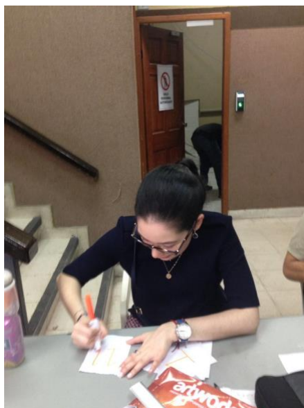
Ilustración 4: “Participación en Inscripción de la I Feria de Emprendimiento e Innovación 2017”