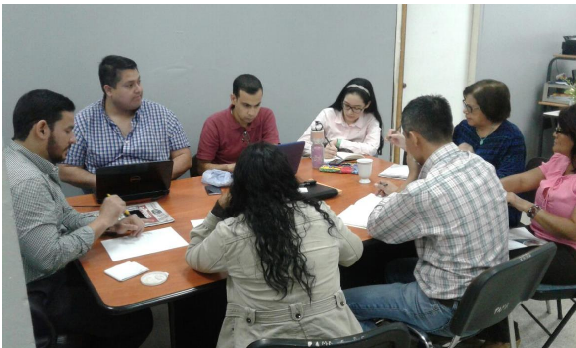
Ilustración 2: “Participación en reuniones previas a la I Feria de Emprendimiento e Innovación”