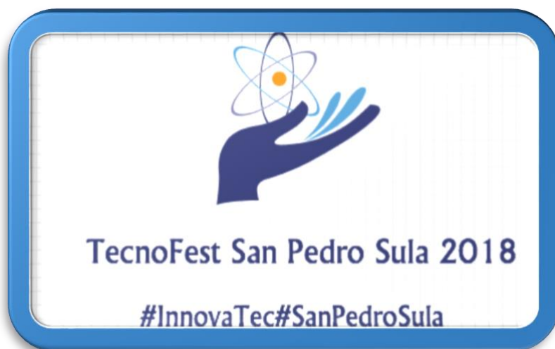
Ilustración 5: “Logo Propuesto para la Feria Tecnológica 2018”