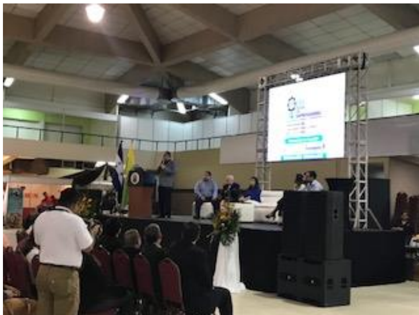
Ilustración 3: “Participación en la I Feria de Emprendimiento e Innovación 2017”