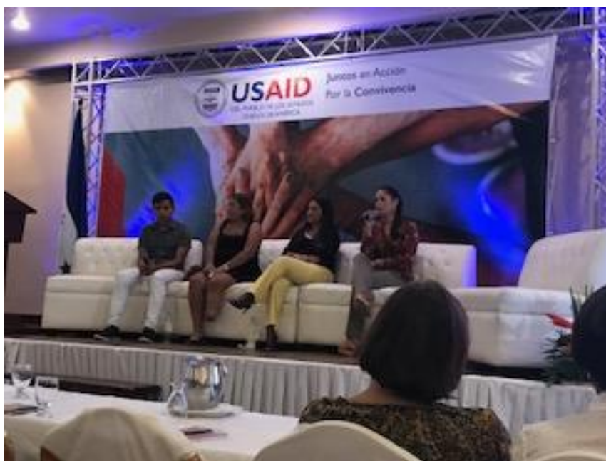
Ilustración 10: “Foro de representantes de sociedad civil en el Programa de Seguridad y Convivencia USAID”