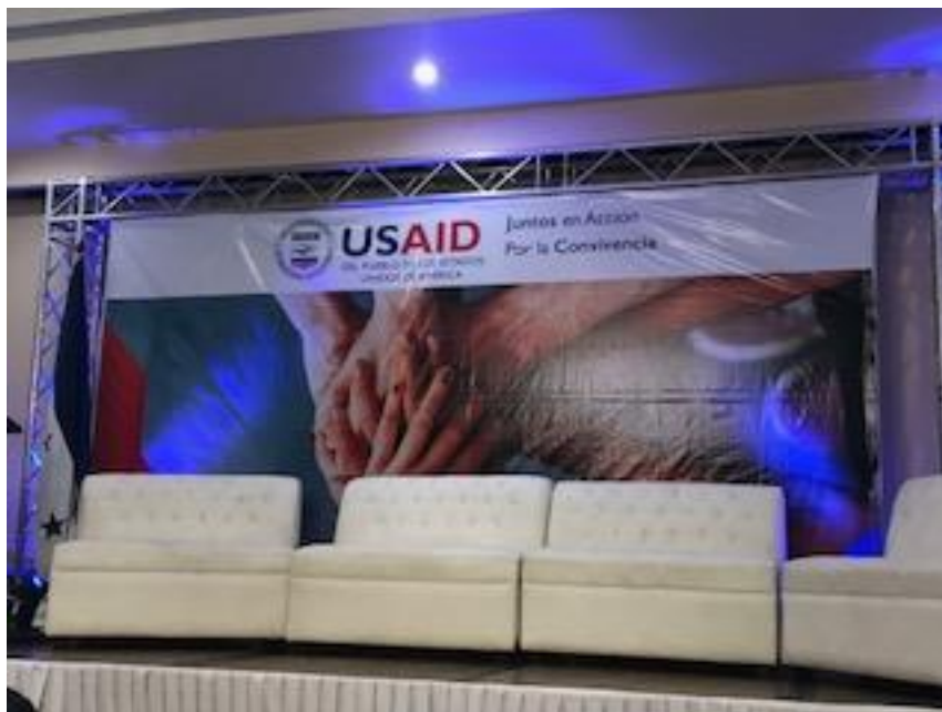
Ilustración 9: “Participación en el Foro sobre el Programa de Seguridad y Convivencia USAID”