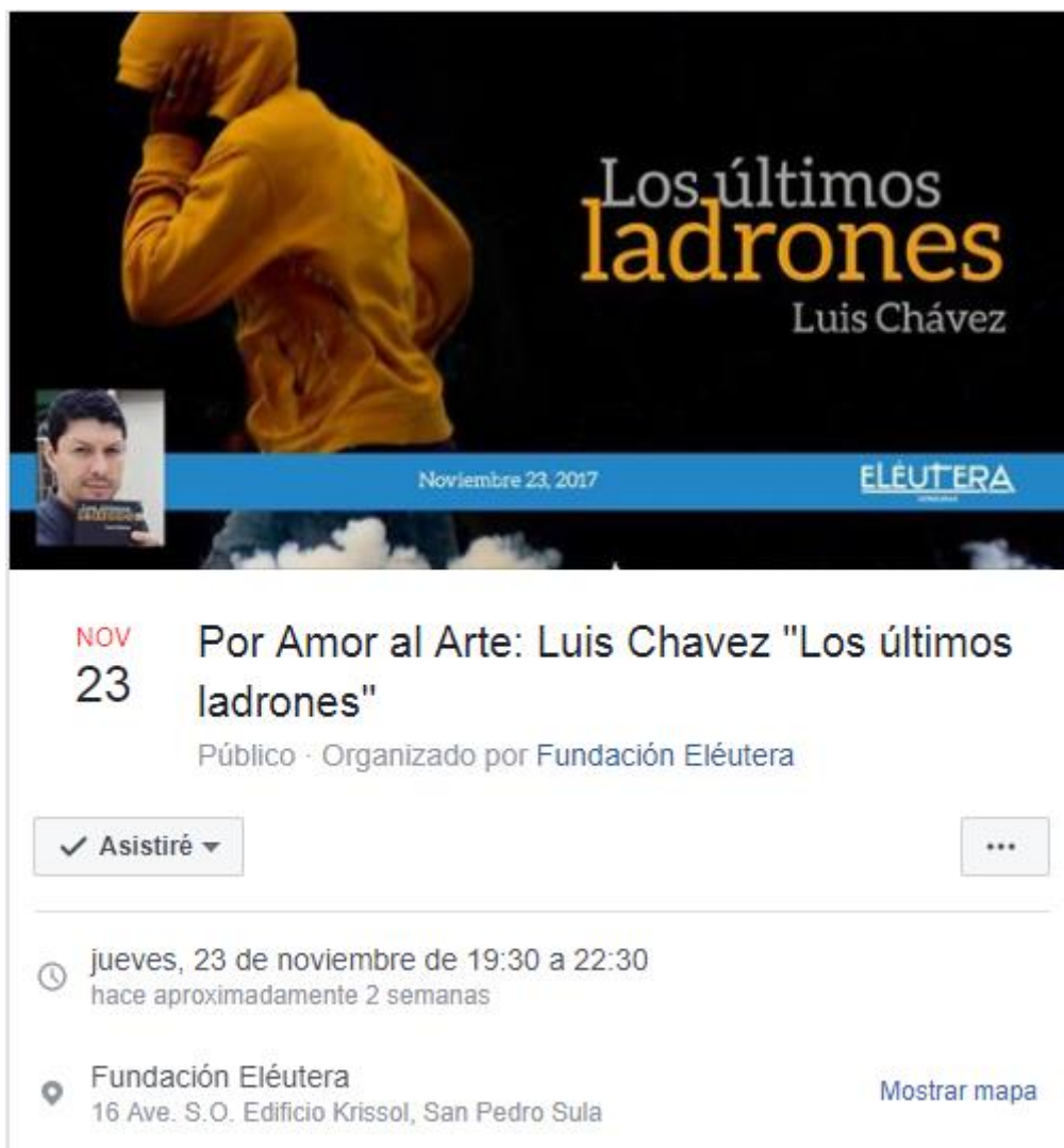
Ilustración 1 Eventos “Por Amor al Arte”