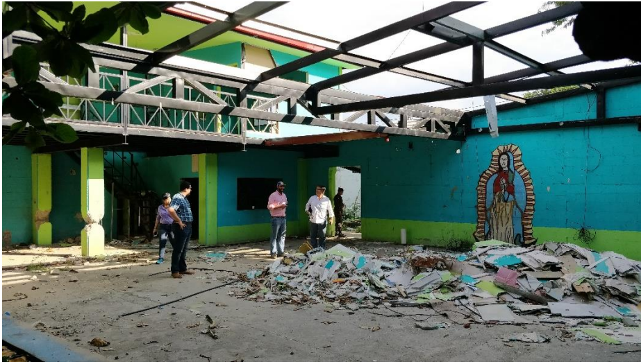
Ilustración 5 Visita al Antiguo Centro Penal de San Pedro Sula