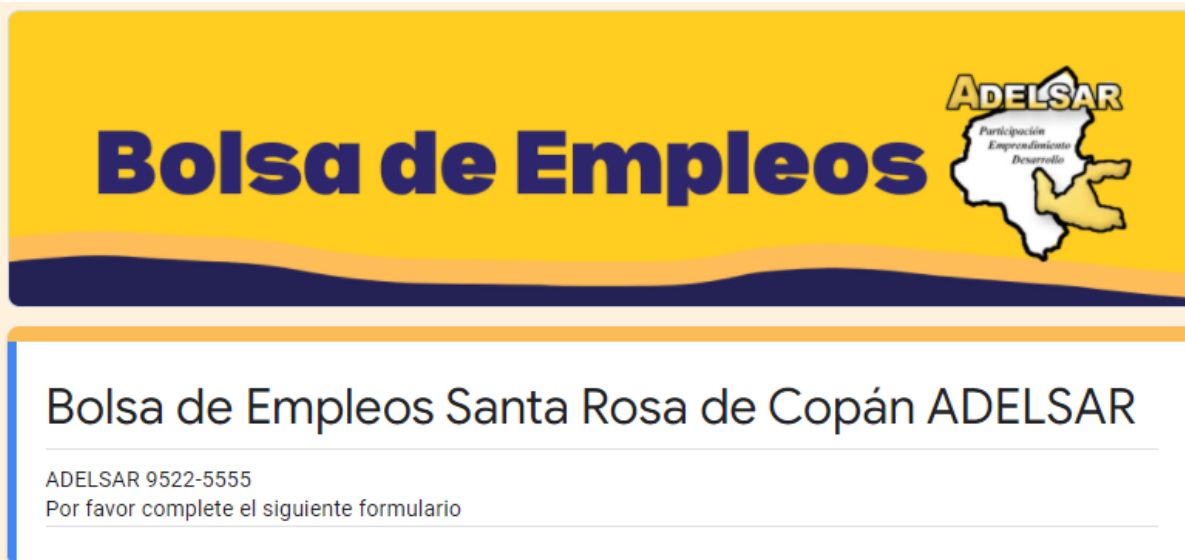
Ilustración 4 Google Forms para las personas que quieren dejar sus datos en la Bolsa de Empleos