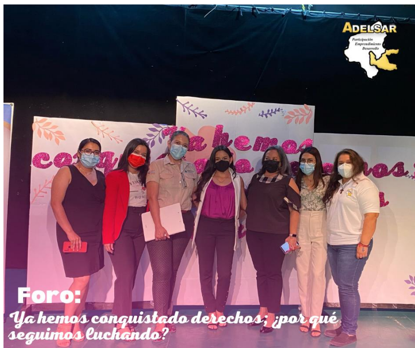
Figure 1 Foro 8 de marzo, staff y expositoras