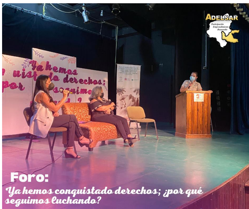
Figure 2 Foro 8 de marzo; expositoras

Link de un reel de Instagram donde se muestran algunos momentos del foro: