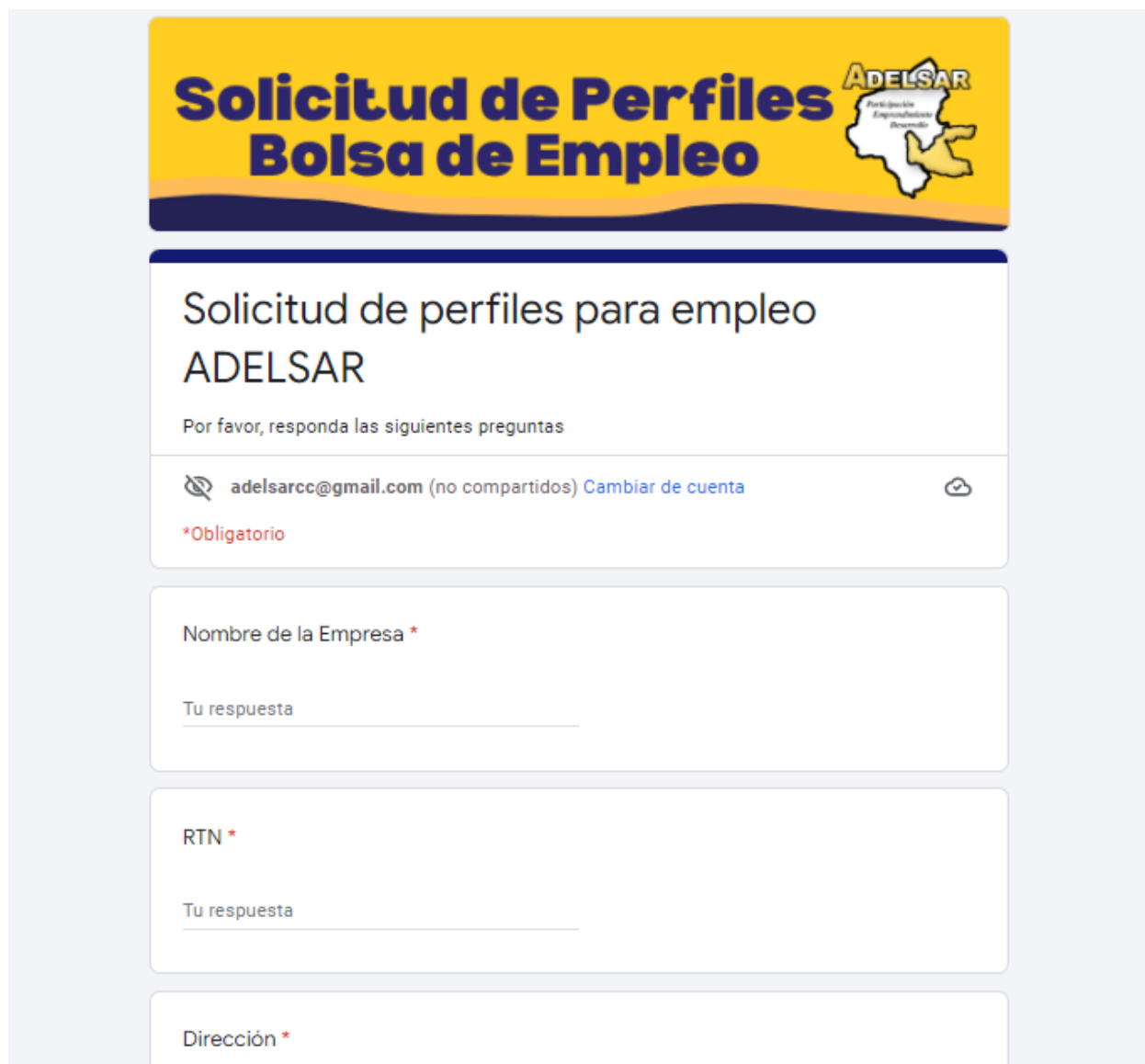
Ilustración 6 Google Forms donde las empresas solicitantes describen el perfil que solicitan