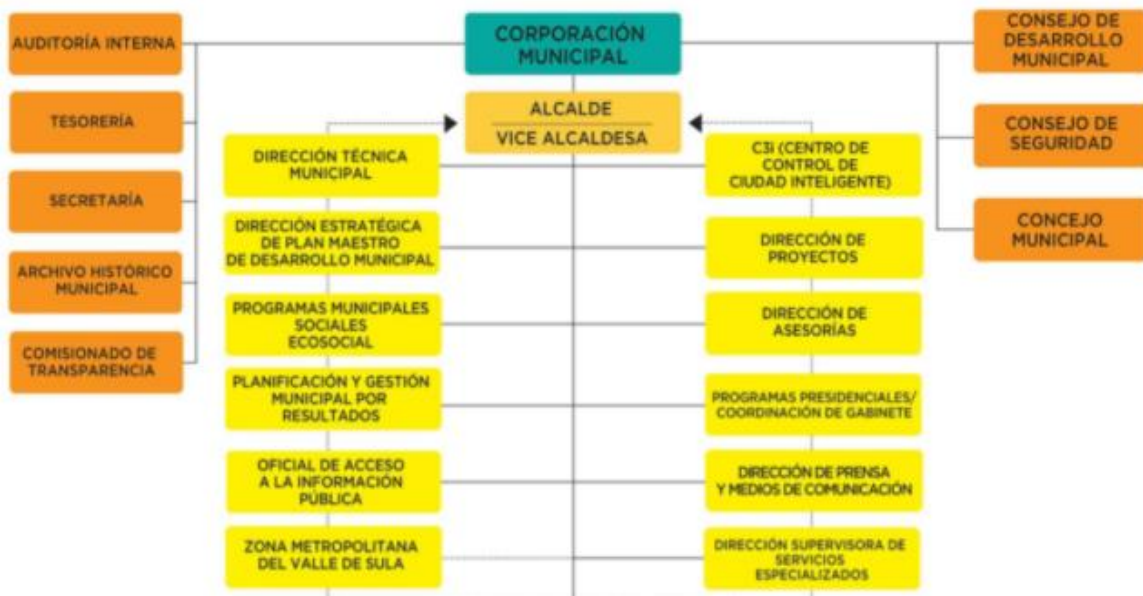
Figura 1. Estructura organizacional