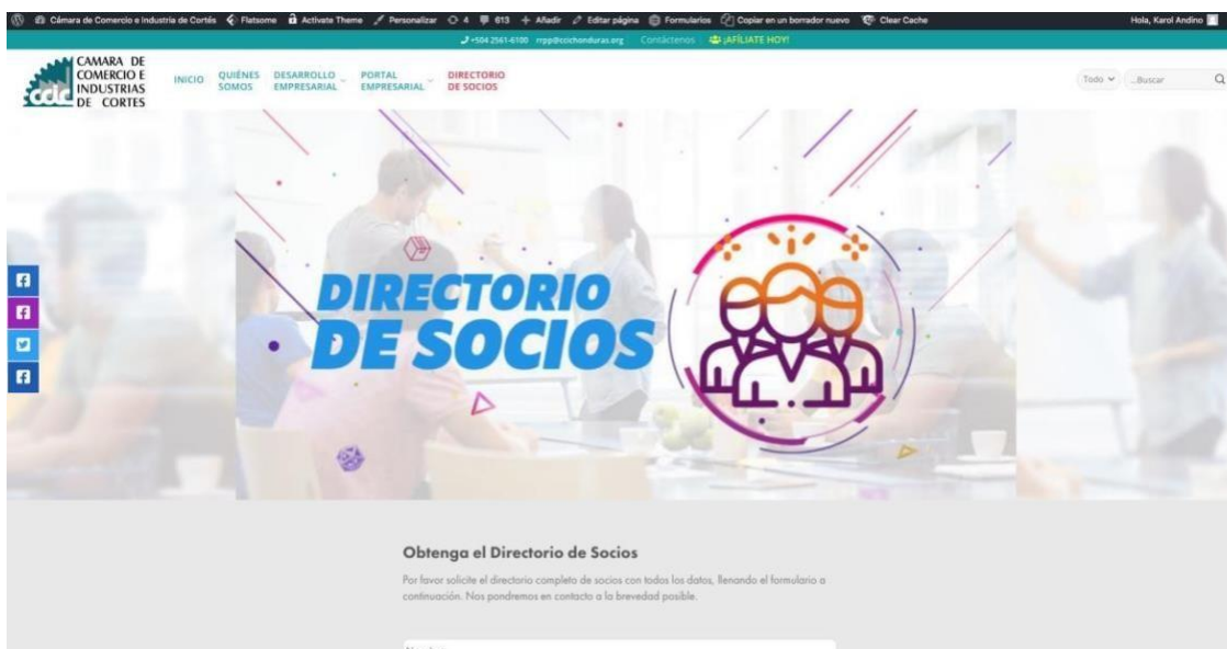
Figura 7. Vista Anterior Directorio Socios.