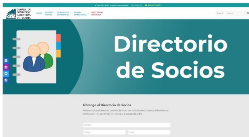
Figura 8. Nueva Vista Directorio Socios.