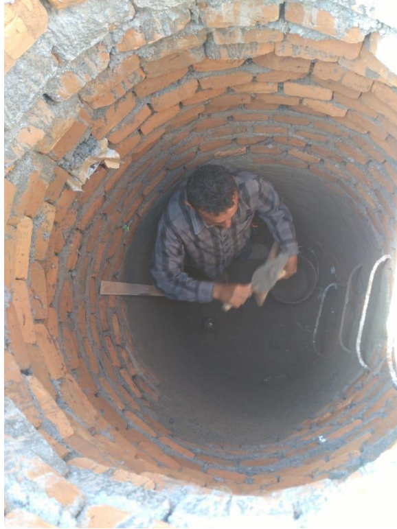
Figura 25. Repello de pozos por parte interna de los mismos