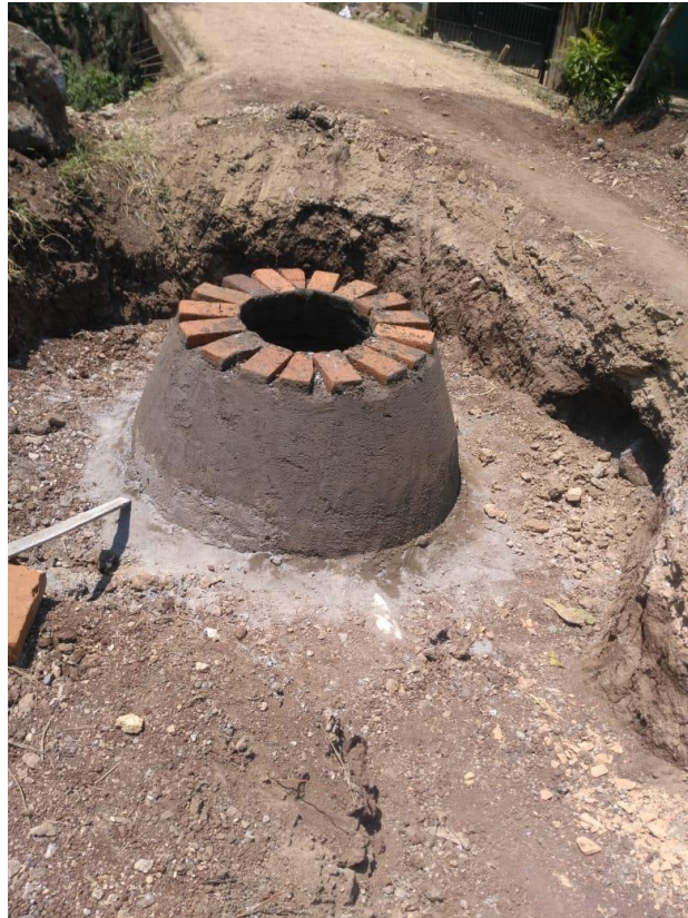
Figura 23. Elaboración de Pozos en la parte central de Santa Cruz