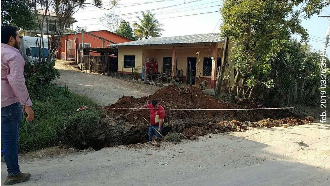
Figura 17. Medición del ancho libre con el que se dejó caja puente