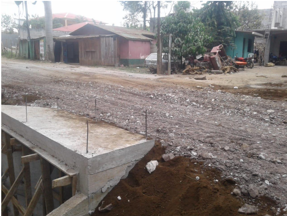
Figura 28. Caja Puente del Reparto en función