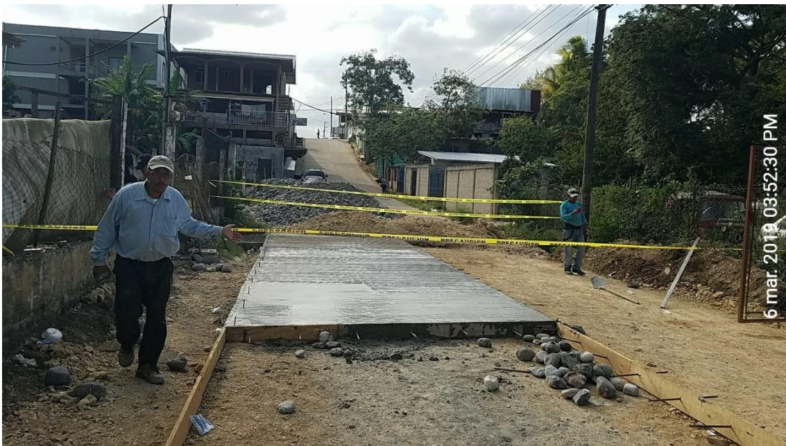
Figura 10. Fundición de Pavimento en la calle Posterior a la Alcaldía Municipal