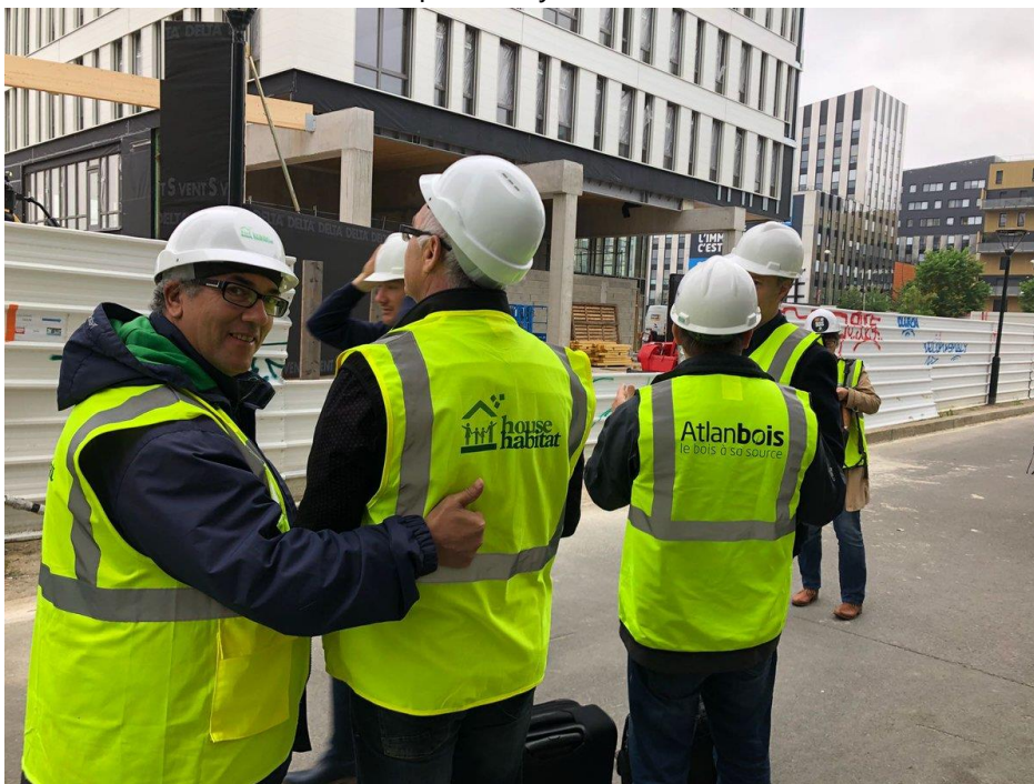
Figura 4. Vista Técnica en construcción de un edificio

Esto nos permite comprobar que los conocimientos adquiridos durante el curso tienen repercusión y aplicación en la realidad, así como poder abrir un debate crítico-constructivo sobre los sistemas empleados y su adecuación.