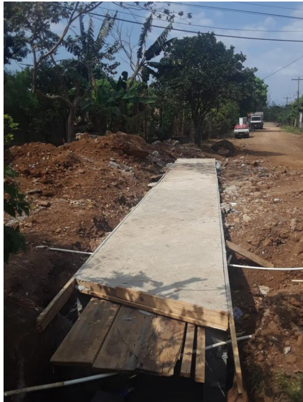
Figura 22. Losa de una caja puente Fundida