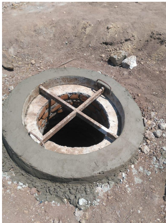
Figura 26. Elaboración de la parte de la Tapadera del pozo