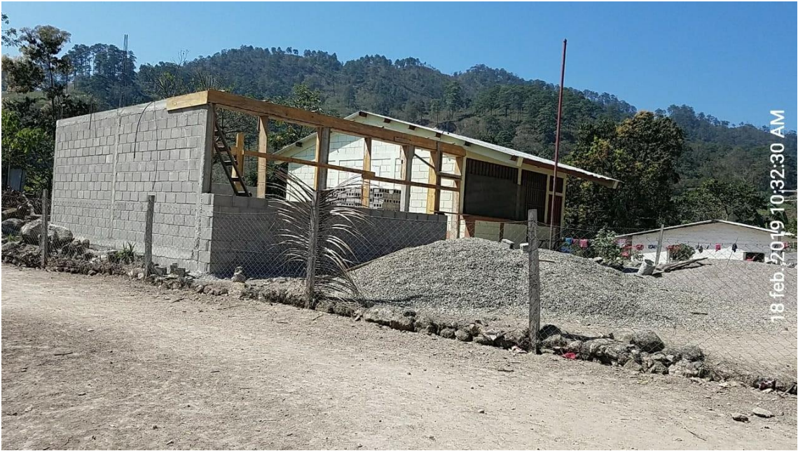
Figura 19. Elaboración de Aula en la Aldea Piletas