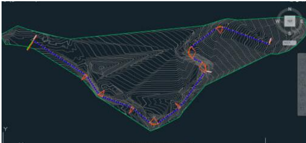
Figura 6. Dibujo de Plano de tramo carretero, con curvas de nivel y superficie marcada en AutoCAD Civil 3