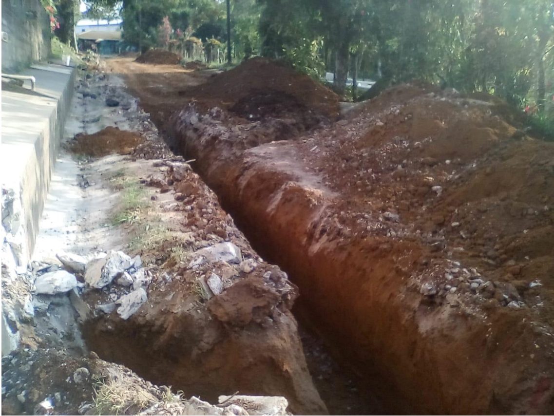
Figura 29. Rompimiento de calles para instalación de Alcantarillado Sanitario