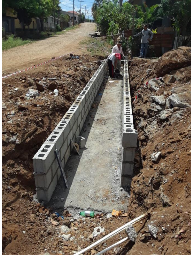
Figura 27. Colocación de la pared de bloque de una caja puente