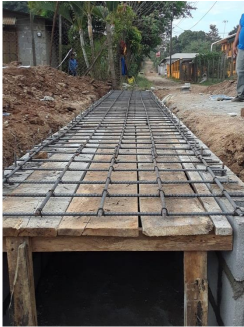
Figura 21. Armado de varilla colocado para la fundición de losa en caja puente