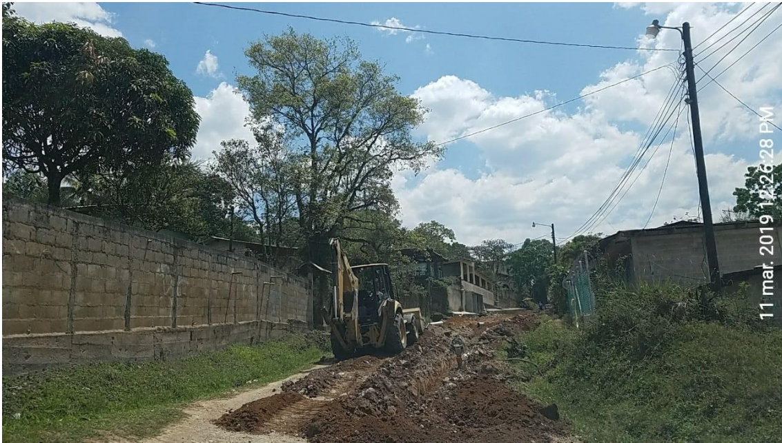
Figura 9. Rompimiento de calles para instalación de tuberías para Alcantarillado Sanitario en Barrio Capiro