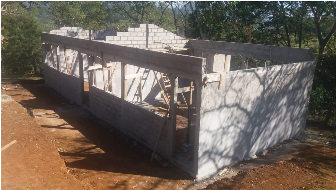
Figura 24. Construcción de Dos aulas con sus respectivos baños en la Aldea Agua Azul Rancho