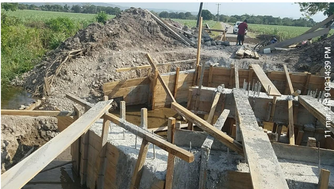
Figura 8. Encofrado en la Construcción del Puente de la Aldea Campo Olivo