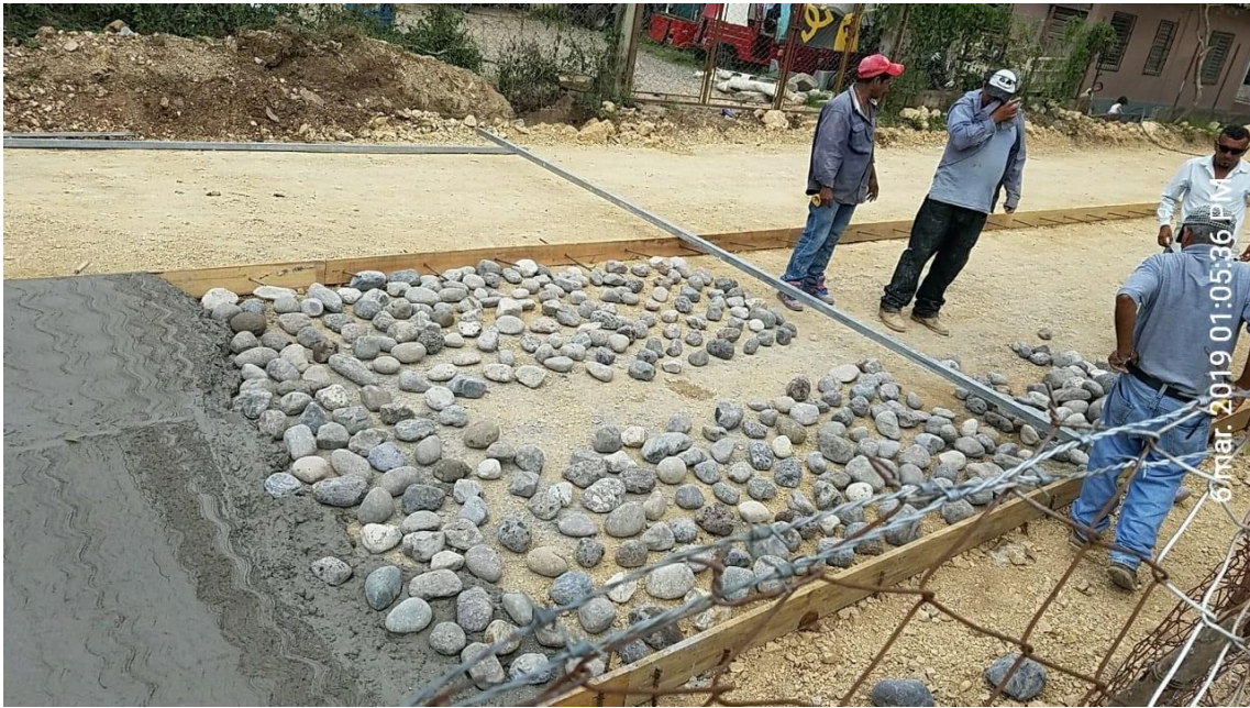
Figura 11. Colocación de piedras utilizadas al momento de fundir la losa de pavimento