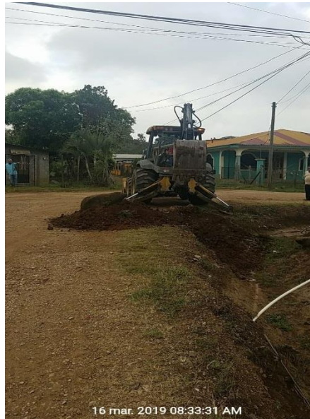
Figura 7. Apertura del terreno en donde se construyó una caja puente en Barrio Suyapa