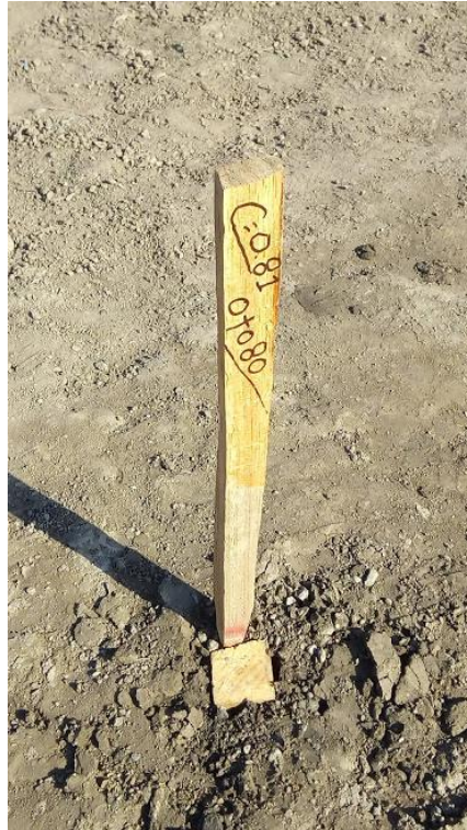
Ilustración 3. Estación 0+080, corte 0.81m.