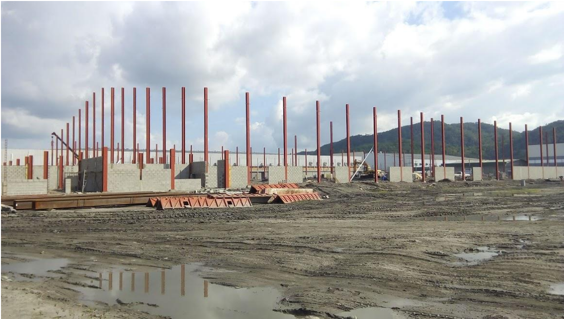
Ilustración 6. Bodega Diunsa-Nestle en el inicio de su etapa constructiva.