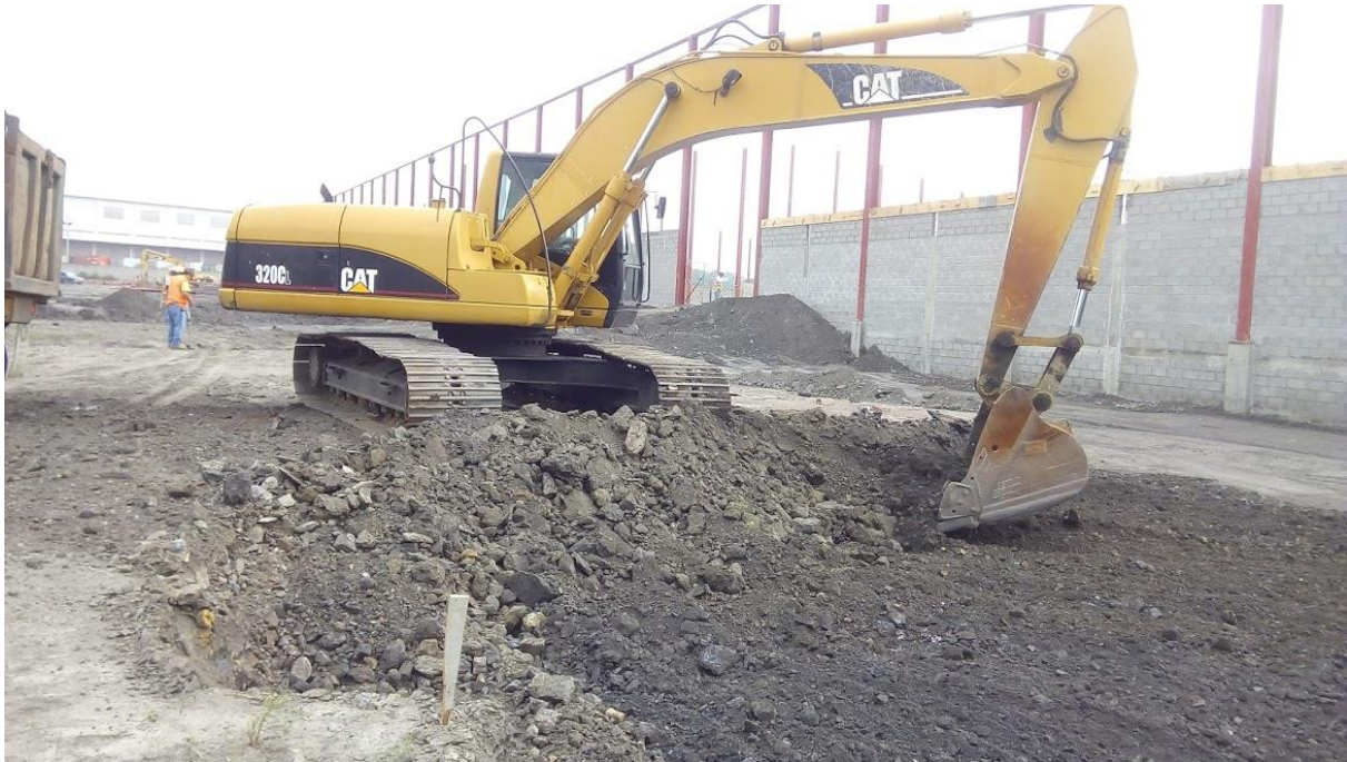
Ilustración 12. Corte con excavadora CAT 320.