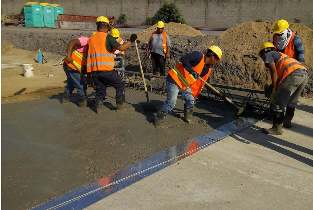
Ilustración 28. Proceso de rastreado en el concreto.