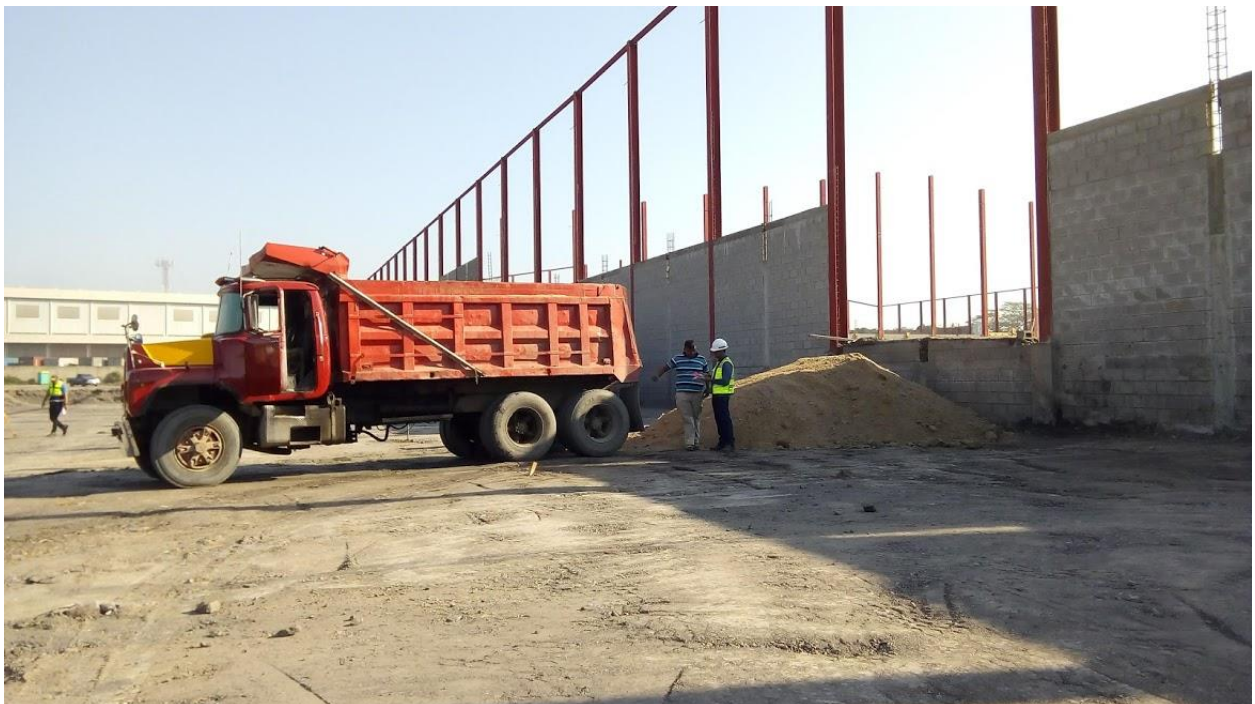
Ilustración 17. Llegada de material selecto para la subbase.