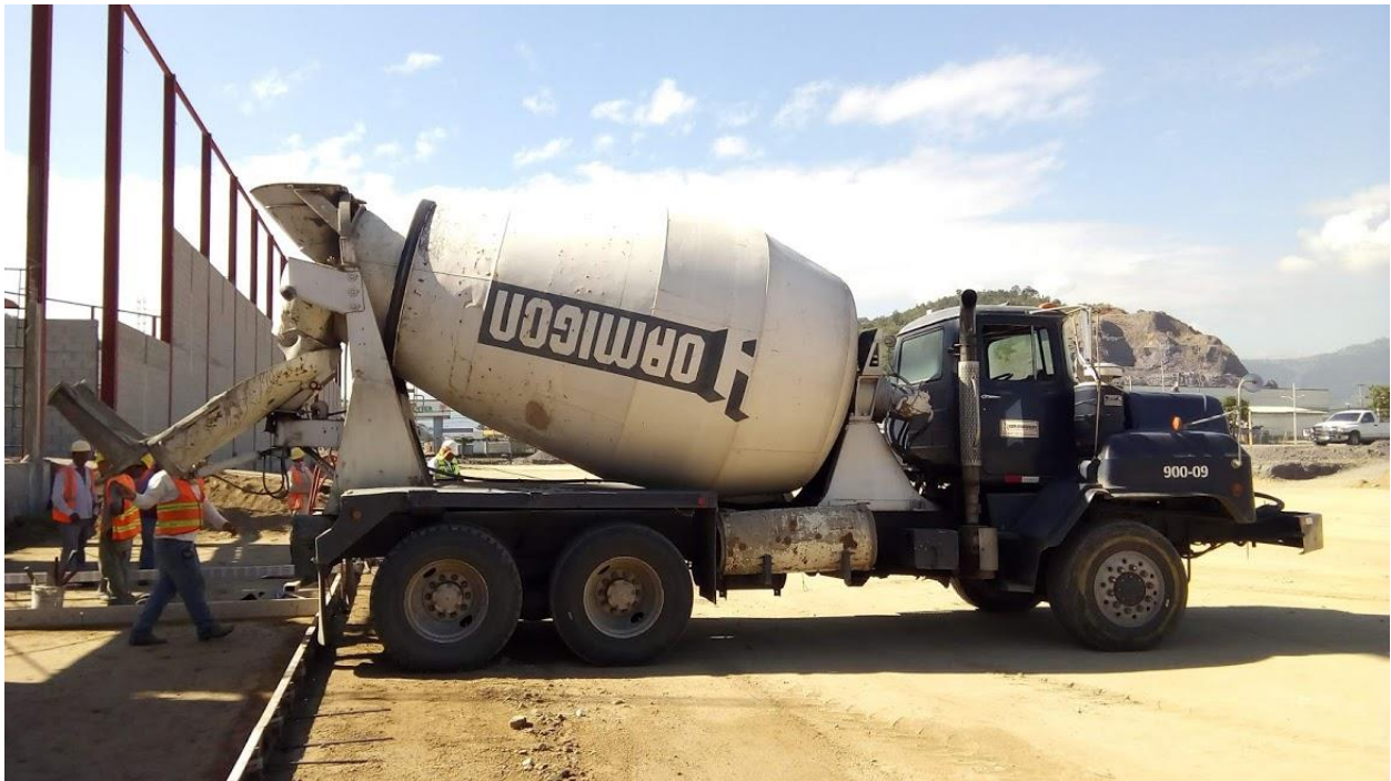
Ilustración 25. Camión mixer de 8m 3 .