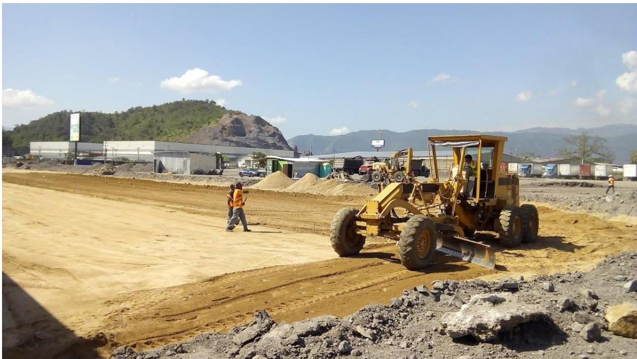
Ilustración 21. Mezclado de subbase.