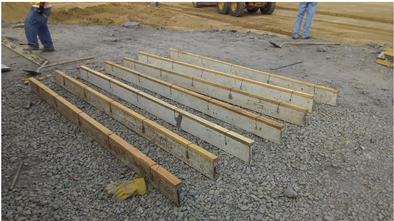
Ilustración 23. Formaletas para fundición.