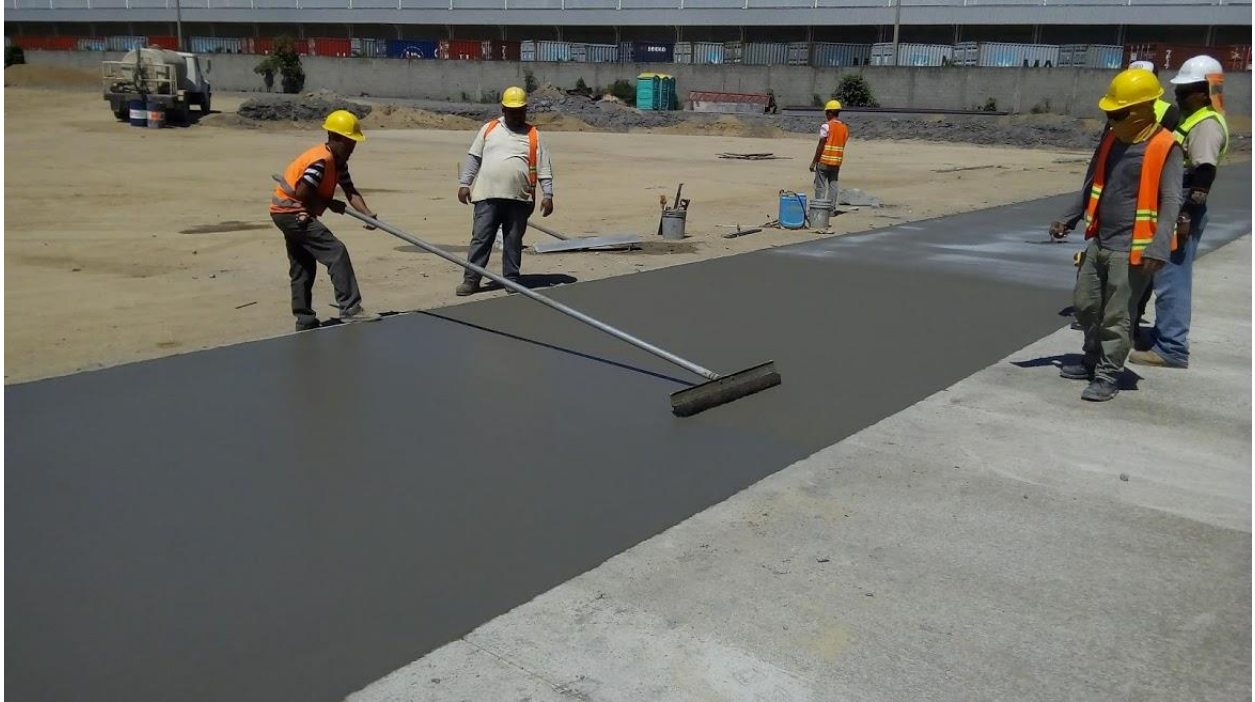
Ilustración 30. Cepillado para darle el toque rugoso al concreto.