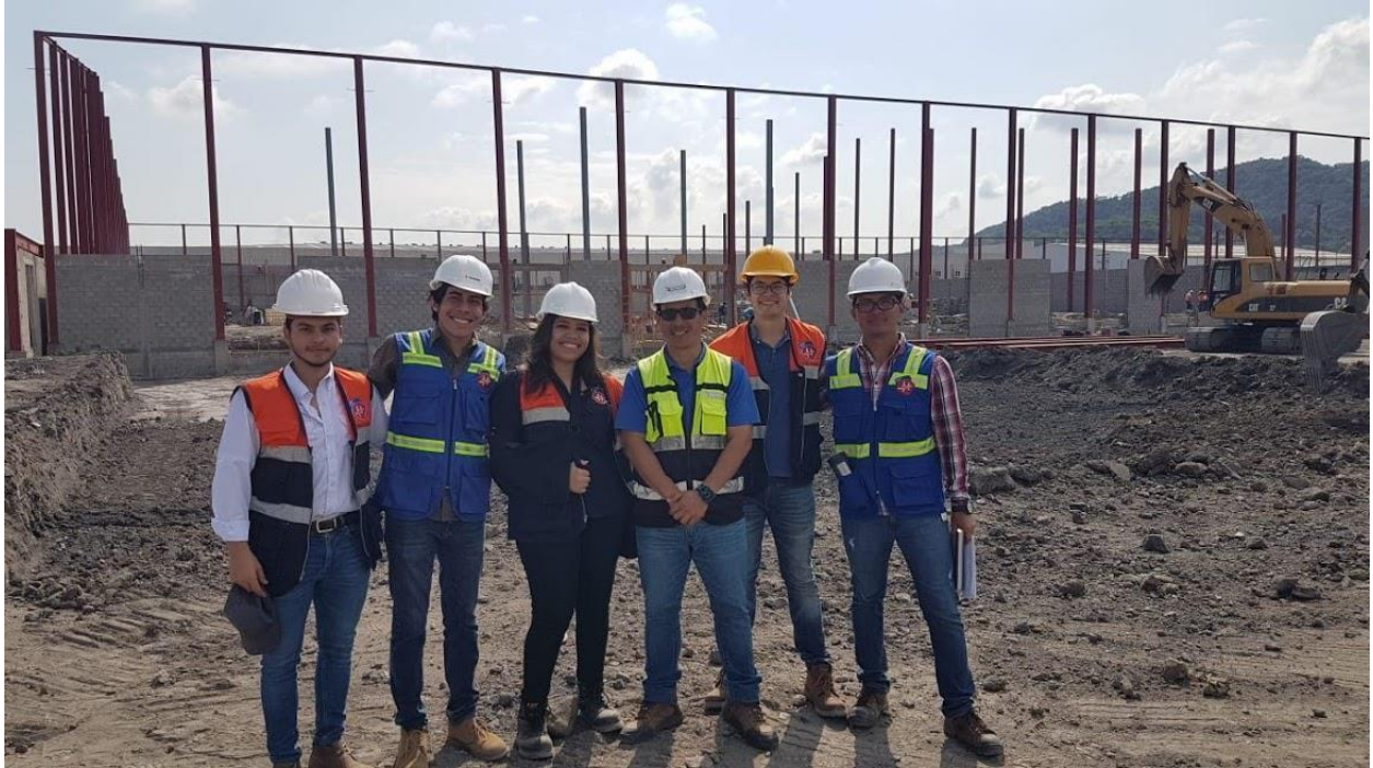
Ilustración 16. Visita al proyecto de los estudiantes de la clase de Administración de obras.