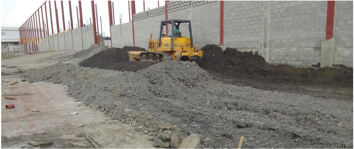
Ilustración 10. Inicio del corte en el sitio mediante tractor CASE 1150G.