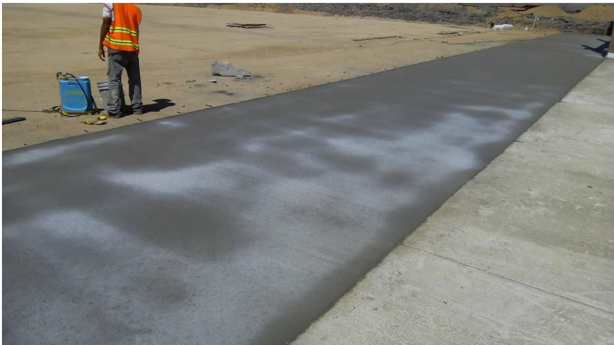
Ilustración 29. Curador anti-sol en la trocha.