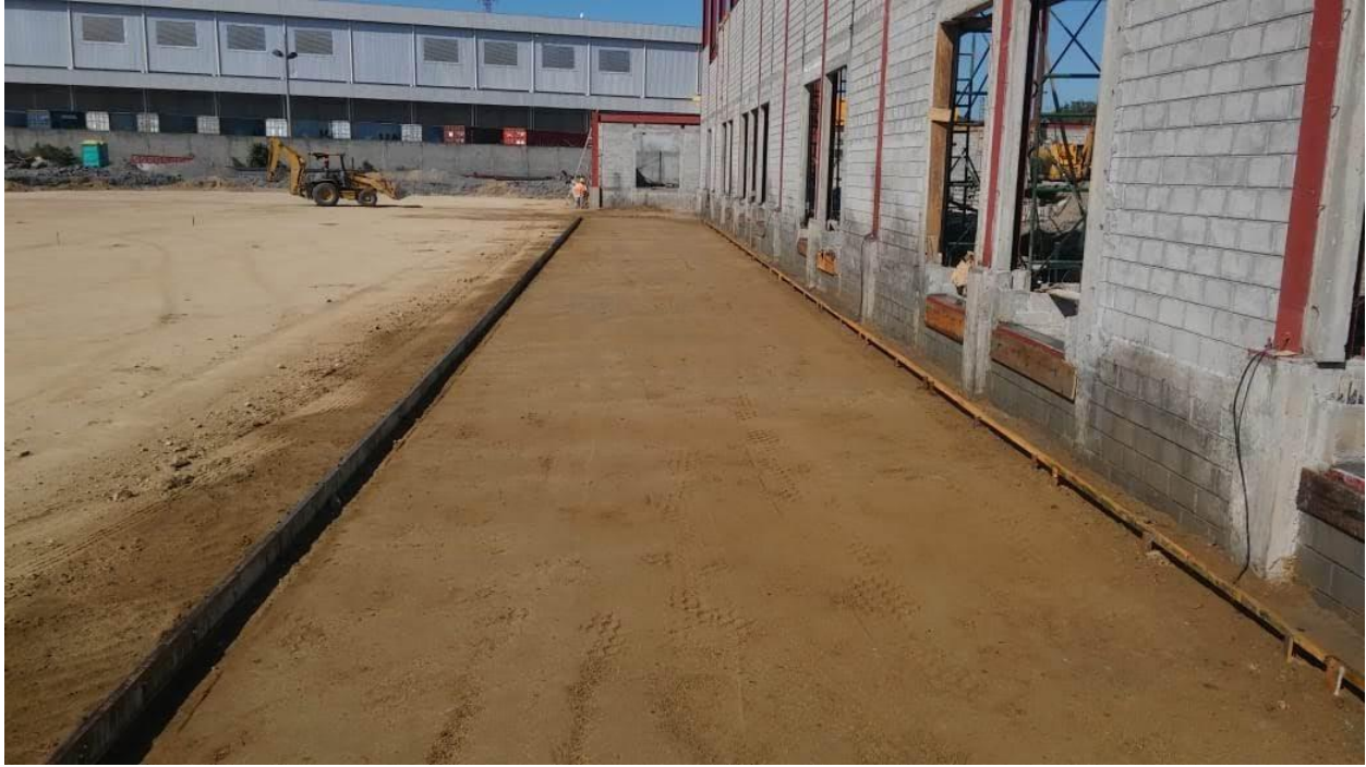
Ilustración 24. Trocha con formaletas colocadas y su suelo afinado y listo para fundición.