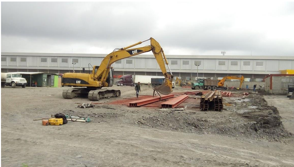
Ilustración 14. Remoción de perfiles metálicos que obstaculizaban la zona.