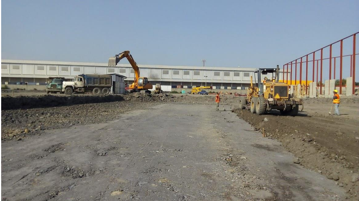
Ilustración 18. Afinamiento de subrasante mediante motoniveladora.