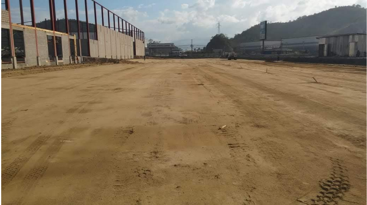
Ilustración 22. Subbase con material selecto totalmente afinada.