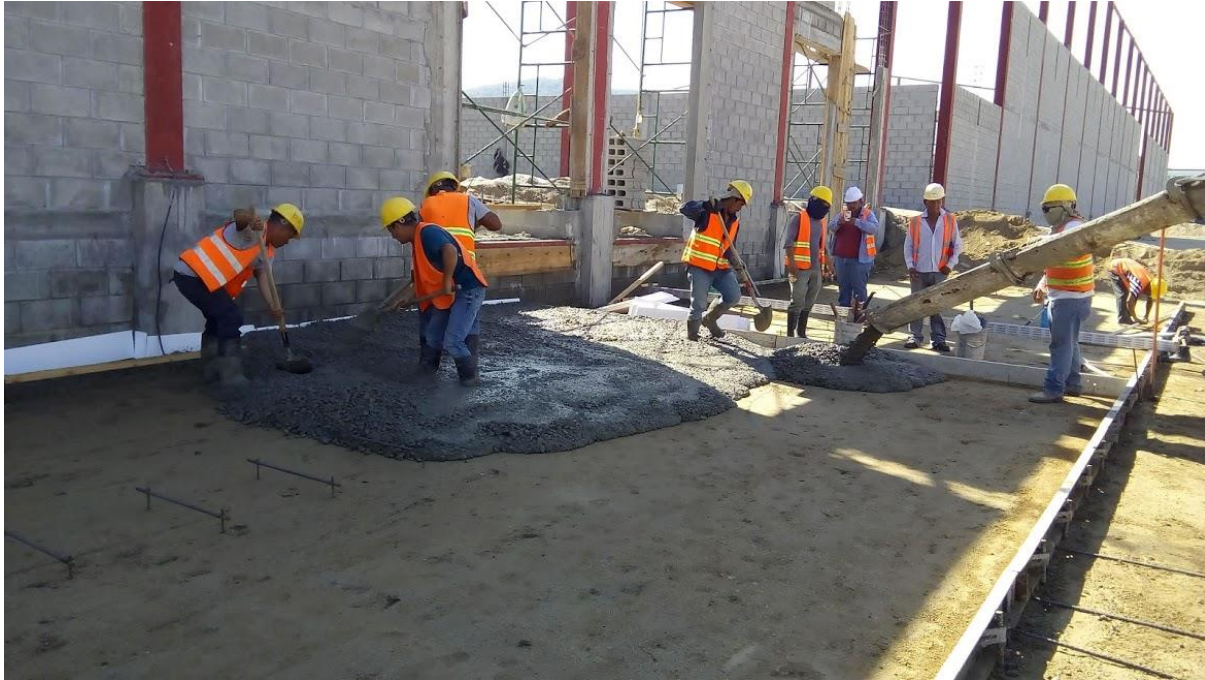
Ilustración 26. Vertido del concreto en trocha de la I etapa del estacionamiento de maniobras para contenedores.