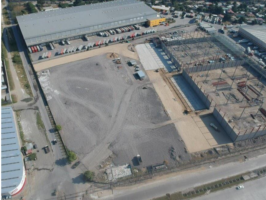
Ilustración 5. Vista aérea del proyecto.