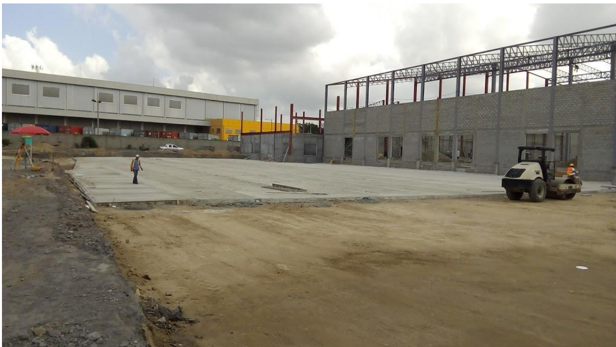
Ilustración 4. Trochas de la I etapa del estacionamiento de maniobras para contenedores finalizadas.

-5 trochas con pastillas de 3.35m x 3.16m (fundidas desde el martes 19 al sábado 23).