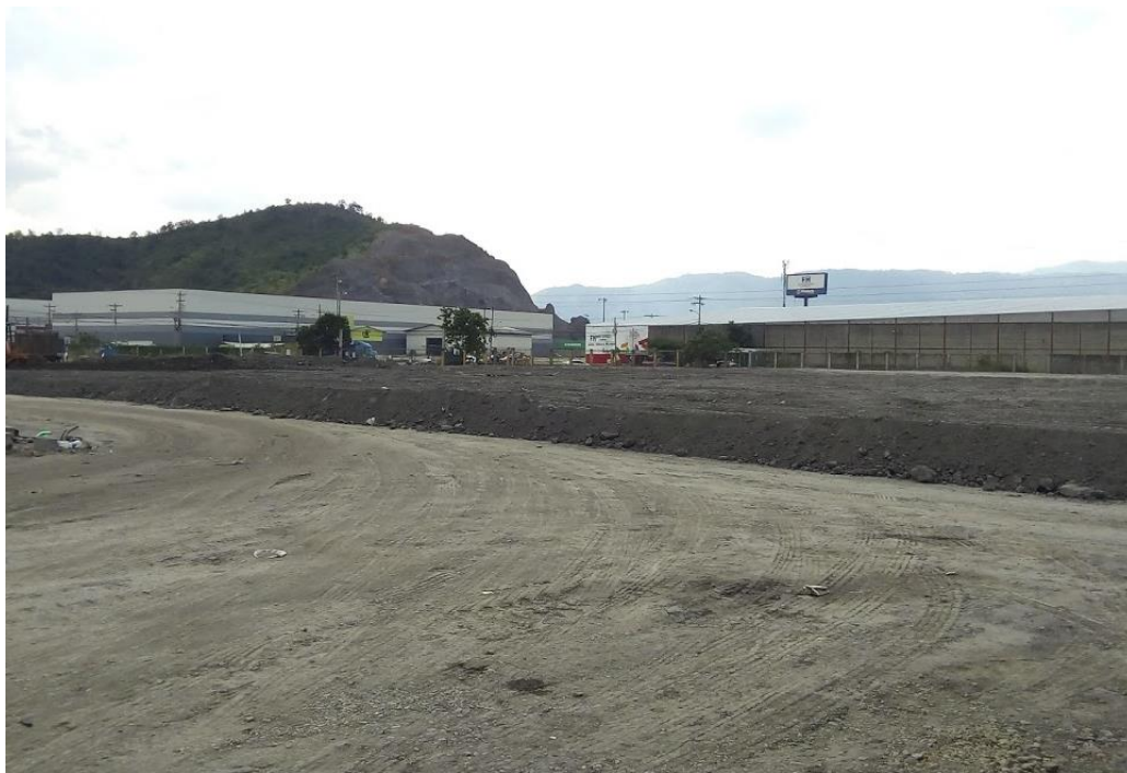
Ilustración 15. Material que se ha cortado y rellenado en el sitio.