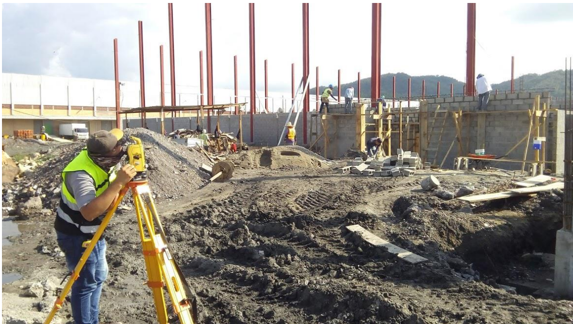
Ilustración 7. Levantamiento topográfico en el sitio.