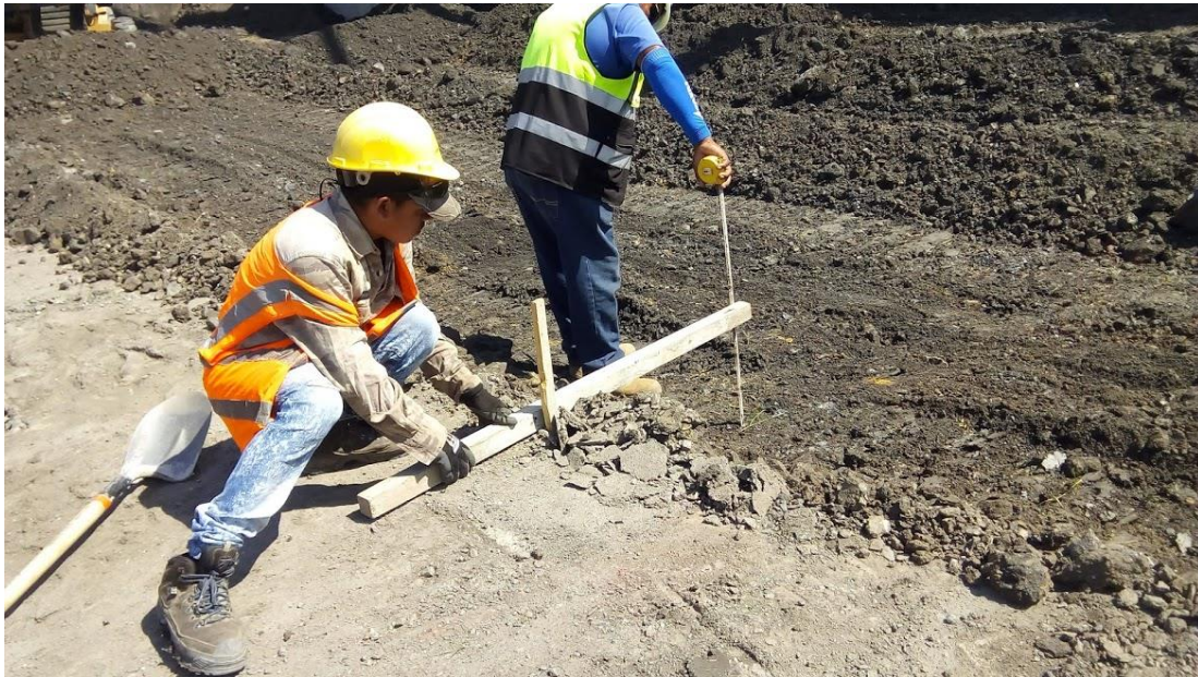
Ilustración 11. Chequeo del nivel hasta el cual se ha cortado.