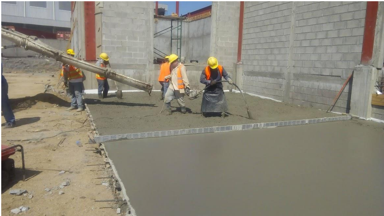
Ilustración 27. Proceso de vibrado en el concreto.