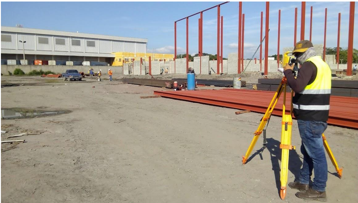
Ilustración 9. Trazado y nivelado para la obtención de volúmenes de corte y relleno.