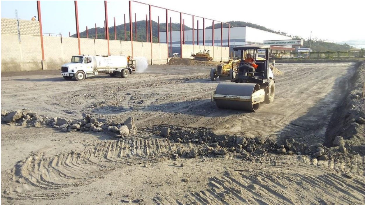
Ilustración 20. Compactado de subrasante con vibrocompactador.