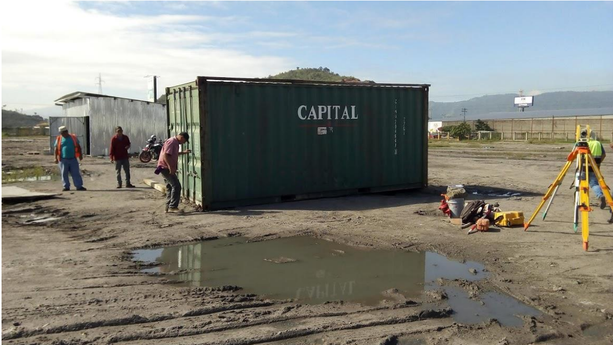
Ilustración 8. Bodega provisional utilizada en el proyecto.