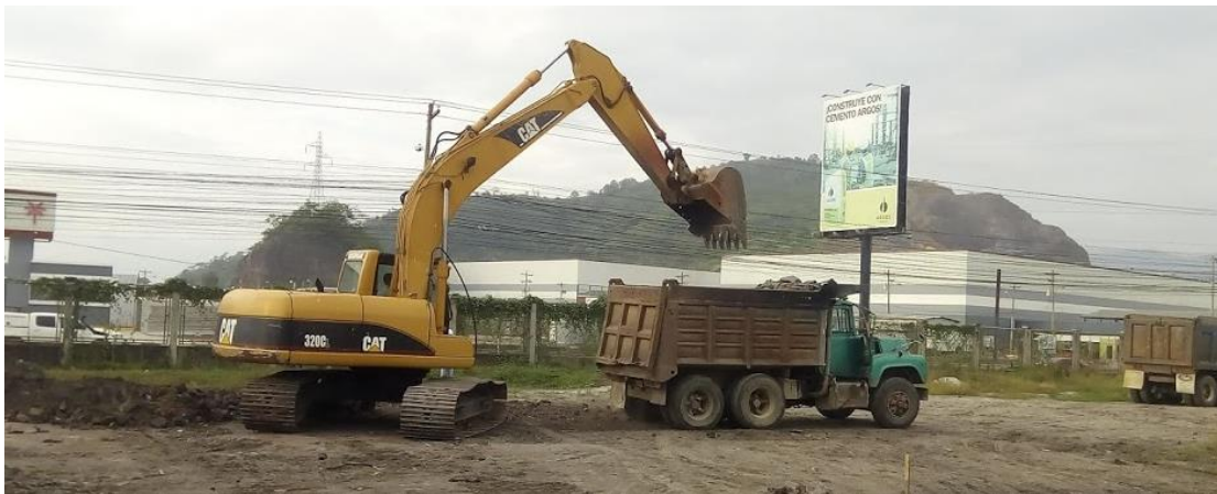
Ilustración 13. El material cortado se deposita en volquetas para trasladarlo hasta el sitio de relleno ubicado en el mismo proyecto.