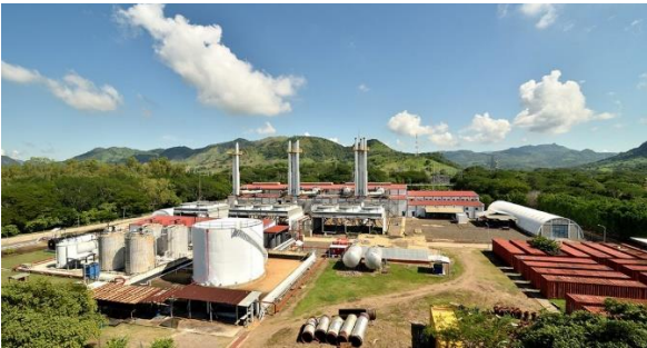
Ilustración 7 LUFUSSA VALLE

hasta registrar el 51% presente en la actualidad. Sumado a esto, en Honduras los porcentajes de producción energética renovable se encuentran bastante distribuidos entre distintas fuentes de explotación, siendo la mayor generación limpia la que proviene de la energía renovable privada con un porcentaje promedio de 32% y la producción de energía hidráulica por parte de la Enee que representa el 19%; mientras que, en paralelo, la generación térmica privada sigue representando el 40.81%. Estos datos dejan claro la lata variedad energética que hoy se presenta dentro del territorio, el cual, si bien es cierto que en el pasado se mantenía atrasado al ser dependiente de un solo modelo energético, hoy en día se abalanza hacia el futuro del desarrollo energético. (Lufussa Online, 2022)