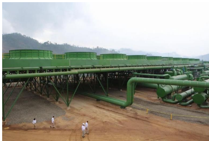
Ilustración 5 Planta Geoplatanares

Durante el 2010, se aprobó la Visión del País 2010-2038 y Plan Nacional 2010-2022. Uno de los objetivos de esta visión es lograr que el 80% de la matriz energética se base en fuentes de energía renovable, con inversiones privadas y públicas, haciendo énfasis en energía hidroeléctrica. Este fue el primer plan en Honduras para el cual se creó una ley específica. En lo referente a la exploración y explotación del recurso geotérmico en Honduras, actualmente no existe un marco regulatorio específico, ya que las leyes vigentes solo regulan el desarrollo de proyectos de generación de energía eléctrica a partir de fuentes de energía renovable (incluyendo los proyectos geotérmicos). En lo que respecta al uso directo de la geotermia (usos industriales de baja entalpía), ésta no se encuentra cubierta por el marco regulatorio, por lo que se carece de cualquier tipo de regulación. (GEOTERMIA EN HONDURAS)