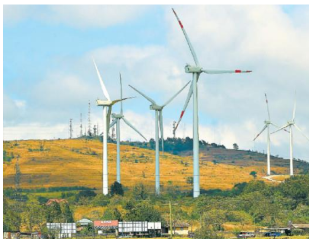
Ilustración 3 Cerro de Hula

de energía, con una capacidad instalada total hasta el año 2018 de 225 MW. Primera planta Eólica fue Mesoamérica, llamado también parque Eólico Cerro de Hula, situado en el departamento de Francisco Morazán, Santa Ana, y San Buena Ventura, con Coordenadas 14° 5N87° 23O, es el primer parque Eólico instalado en honduras. Los vientos de la zona son muy fuertes, en los meses de verano e invierno hay variaciones y se refleja en la generación eléctrica, el parque está muy cerca de la red eléctrica y justo al lado de Carretera del Sur – CA-5. El proyecto comenzó a funcionar en octubre de 2011 la primera etapa 52 aerogeneradores de 2 MW de capacidad, potencia nominal total de 102 MW. (H. ALVAREZ, 2020)