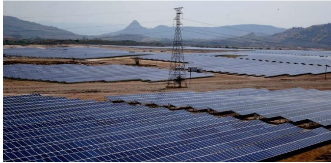
Ilustración 4 Nacaome Valle