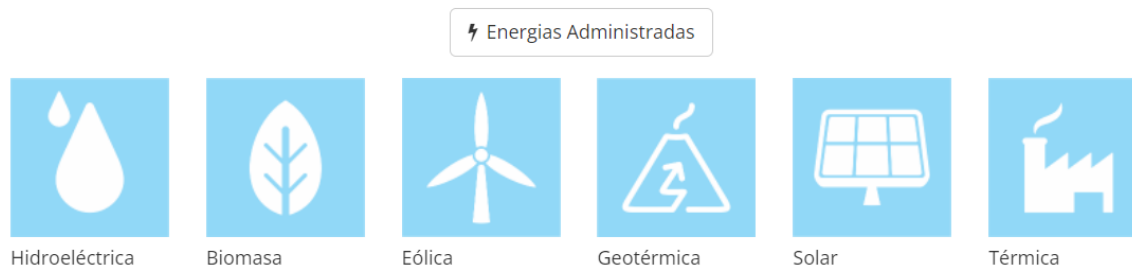
Ilustración 2 Energías Administradas

Las siguientes energías mencionadas son las administradas por ODS