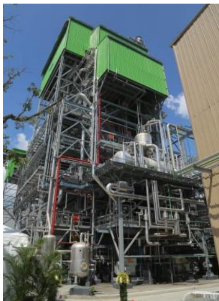
Ilustración 6 Planta de Biomasa HGPC