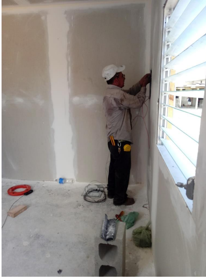
Figura 2 Instalación eléctrica de oficina provisional