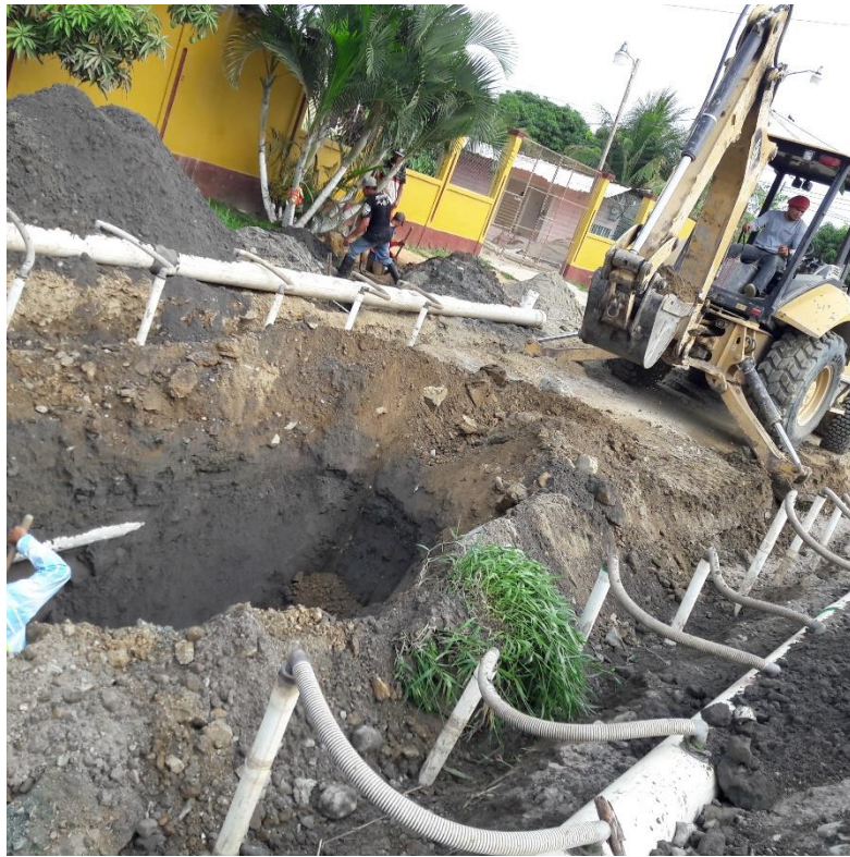
Figura 22 Equipo de punteo