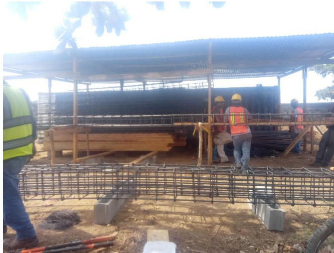
Figura 3 Armado de acero de columnas