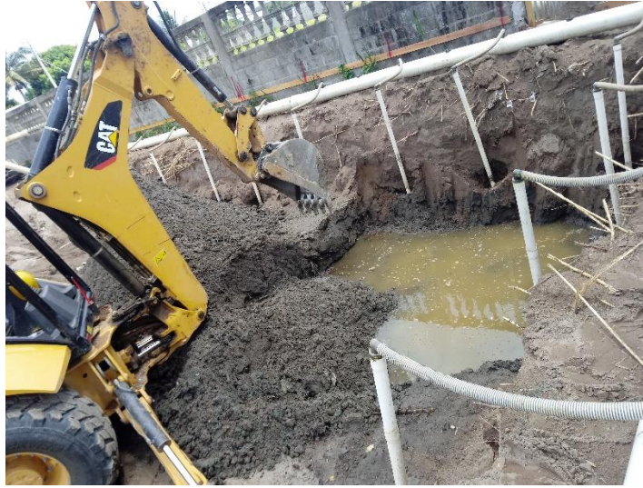
Figura 11 Excavación de zapatas a nivel final