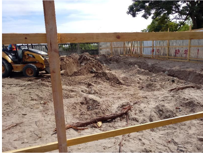
Figura 8 Excavación de terreno para zapatas