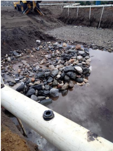
Figura 17 Estabilización de terreno de losa de cimentación