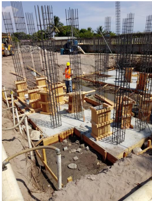
Figura 15 Encofrado de pedestales