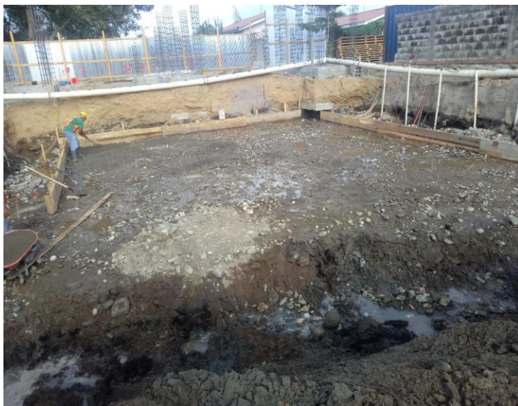
Figura 19 Niveleado y armado de encofrado losa de cimentación