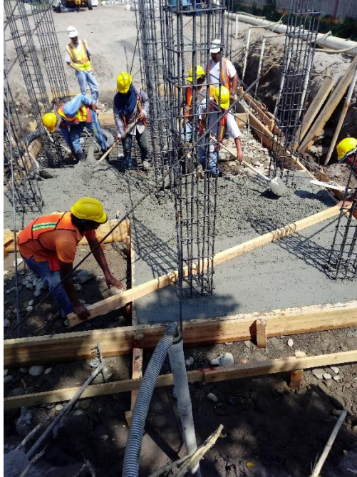
Figura 14 Fundición de zapatas