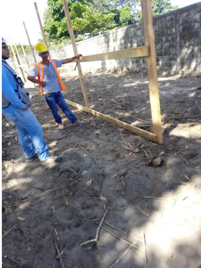
Figura 6 Cerco provisional trasero de proyecto