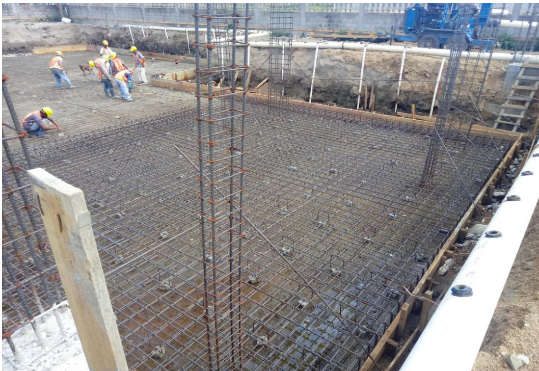
Figura 20 Armado de acero de losa de cimentación y columnas