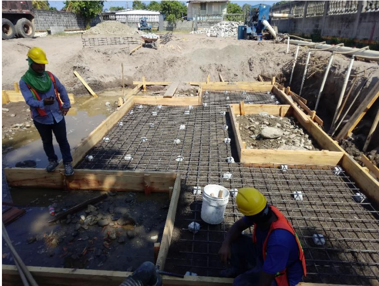
Figura 13 Armado de acero de zapatas