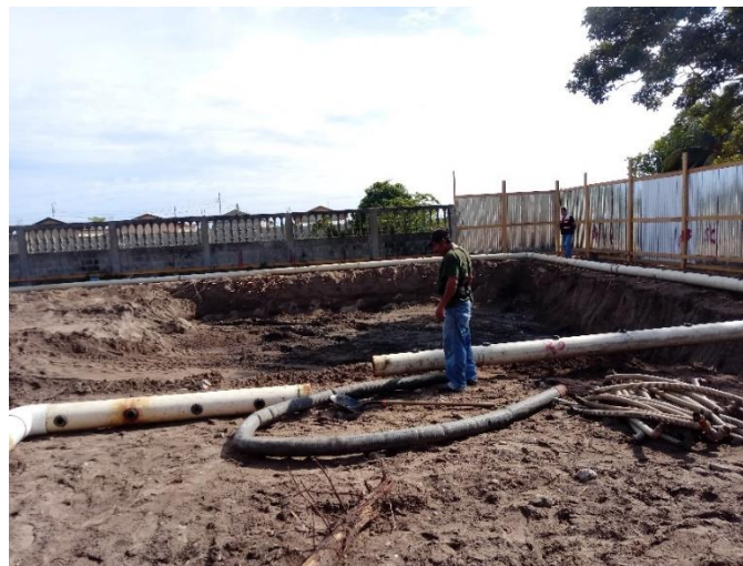
Figura 10 Armado de colectores para proceso de punteo