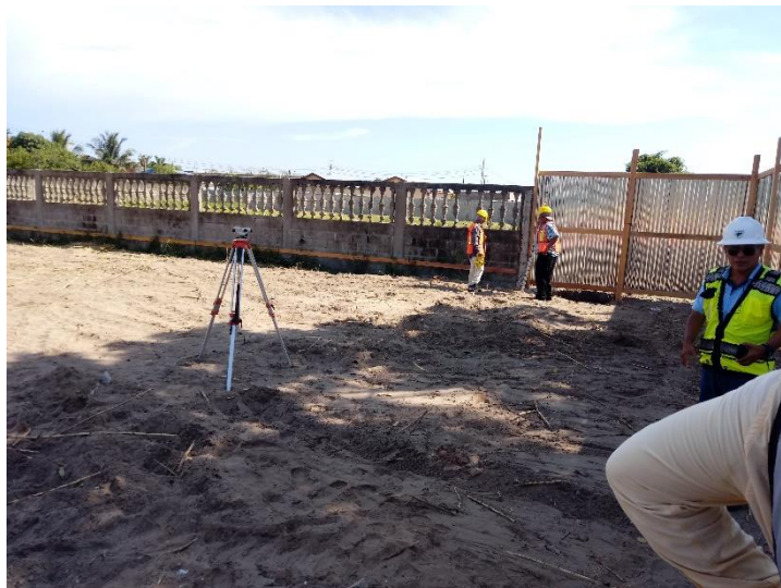
Figura 7 Levantado de niveletas para marcar nivel de piso terminado