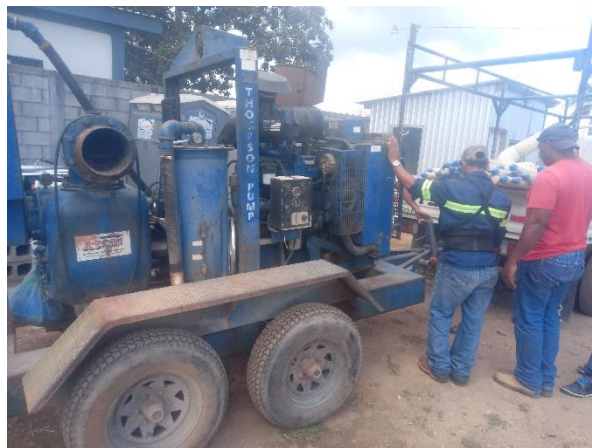
Figura 5 Entrega de bomba de succión para proceso de punteo