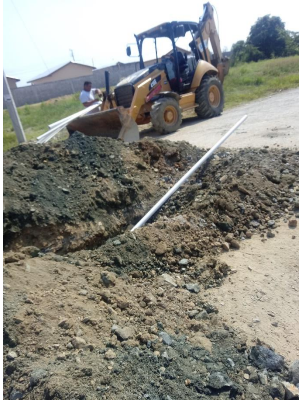
Figura 1 Instalación de acometida de agua potable