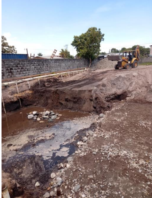
Figura 18 Excavación de losa de cimentación