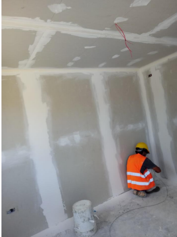
Figura 4 Paredes de tabla de yeso oficina provisional