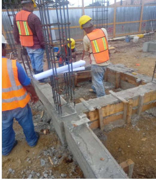
Figura 16 Desencofrado viga de arriostre