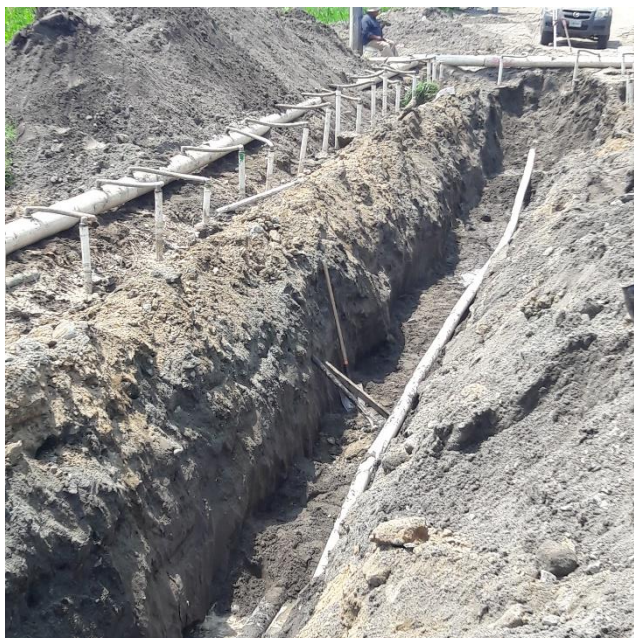
Figura 21 Excavación para alcantarillado sanitario