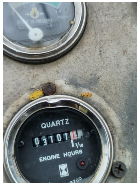
Ilustración 6-Horometro de maquinaria

Consideración de la eficiencia y condiciones del terreno: Ten en cuenta la eficiencia de la maquinaria y las condiciones del terreno al realizar los cálculos. Por ejemplo, un terreno más difícil de trabajar puede requerir más tiempo y esfuerzo, lo que afectará el rendimiento de la maquinaria.