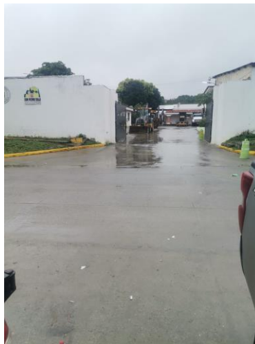
Ilustración 5-Oficinas de infraestructuras en San Pedro Sula

Preparación de expediente completo: Organiza todos los documentos de manera ordenada y completa, siguiendo las instrucciones y requisitos específicos establecidos por la municipalidad para la presentación del proyecto.