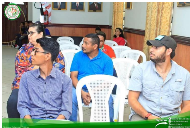
Ilustración 8-Foto oficial de las redes sociales de la municipalidad de Choloma