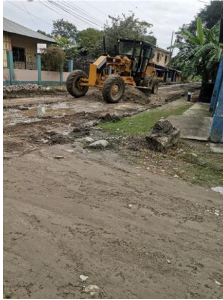
Ilustración 3-Equipo de la empresa