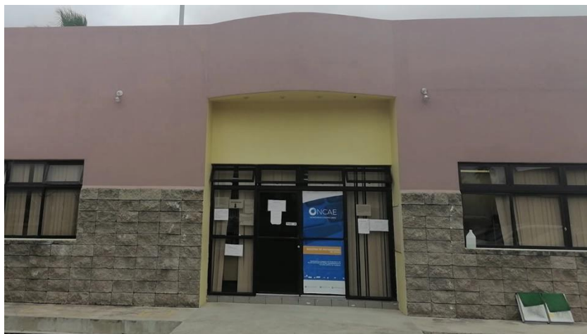
Ilustración 9-Edificio de la ONCAE en Tegucigalpa