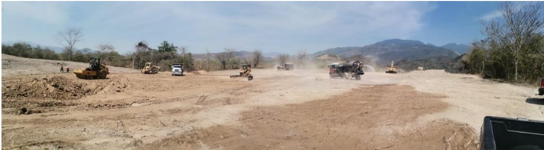
Ilustración 10-Trabajos de Terracerías en Santa Barbara

En la fase I del proyecto de terracería en el Hospital de Santa Bárbara, es fundamental llevar a cabo una planificación detallada que incluya la secuencia de trabajo, la asignación de recursos y los plazos de entrega. Además, se debe realizar una evaluación exhaustiva del sitio para comprender la topografía del terreno y las condiciones del suelo. Es crucial coordinar las actividades con otras empresas que puedan estar trabajando en el mismo sitio y priorizar la seguridad en el lugar de trabajo en todo momento. Asimismo, se debe establecer un sistema de control de calidad para garantizar que el trabajo se realice según los estándares requeridos. Mantener una comunicación abierta y transparente con todas las partes interesadas, así como gestionar eficientemente los recursos disponibles, también son aspectos clave para el éxito de la fase I del proyecto. Además, es importante mantenerse preparado para adaptarse a cualquier cambio en el proyecto y abordar los desafíos de manera efectiva.