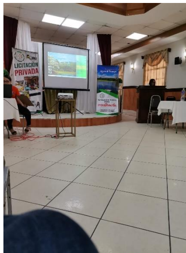
Ilustración 7-Realización de Licitación en Palacio Municipal de Choloma

Seguimiento y respuesta a consultas: Esté disponible para responder cualquier consulta o solicitud de aclaración por parte de la Municipalidad de Choloma durante el proceso de evaluación de las ofertas. Proporcione información adicional o aclaraciones según sea necesario para garantizar que tu oferta sea evaluada de manera justa y completa.