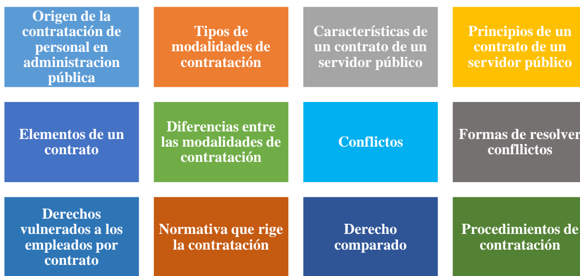
Ilustración 2. La presente ilustración, presenta la estructura conforme al desarrollo del tema de “Los derechos otorgados a los empleados públicos que están modalidad de acuerdo y los de contrato laboral”.

La parte importante de la investigación es establecer antecedentes históricos, como ser: el origen de la contratación, los tipos de modalidades de contratación, las características de un contrato de un servidor público, los principios del contrato, sus elementos, las diferencias entre las modalidades de contratación, conflictos, las formas de resolver los conflictos, los derechos vulnerados, la normativa, el derecho comparado y los procedimientos de contratación.