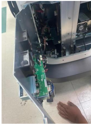
Ilustración 23 – Mantenimiento preventivo a un ultrasonido

Se realizó mantenimiento preventivo a un ultrasonido s60 marca Sonoscape, el cual estaba demasiado sucio, presentaba humedad en su teclado el cliente aseguraba que había teclas no funcionaban, de igual manera se calentaba y se limpiaron las ventiladoras que estaban atascadas de polvo, se hizo limpieza general y se secó el teclado se limpiaron sus componentes, el equipo quedó funcional al 100%.