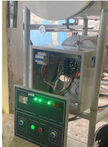
Ilustración 10 – Mantenimiento correctivo a una autoclave