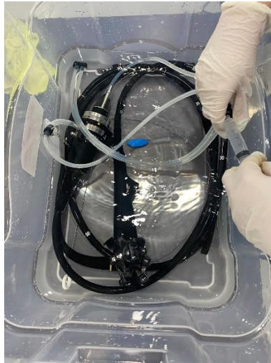
Ilustración 37 – Limpieza y prueba de fuga de colonoscopio

del bending se encontraba reventado debido a un mal uso , se procedió a solicitar el repuesto a fabrica para su cambio, la segunda sonda presentaba problemas en su canal aire agua, ya que al salir por la punta distal no esparcía de la mejor manera el agua , al revisar se observó que el canal aire agua no presentaba obstrucción pero el Nozzler se encontraba en mal estado, se procedió a realizar cambio de este mismo.