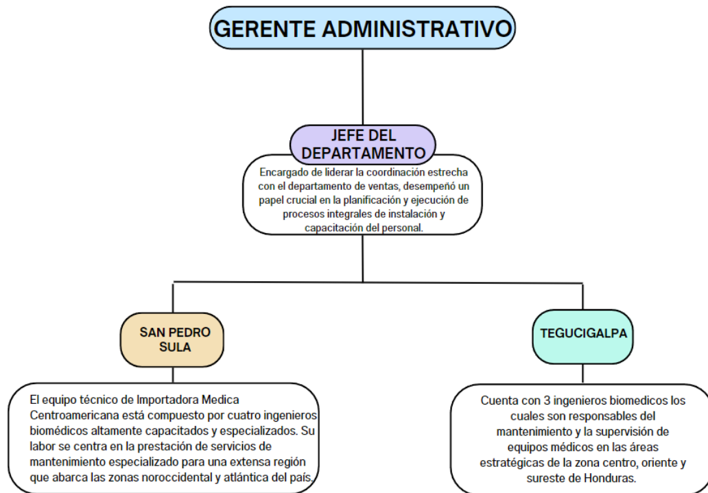
Ilustración 2 – Organigrama del departamento

La empresa cuenta con un departamento de biomédica que consta de 7 ingenieros biomédicos, distribuidos en Tegucigalpa y San Pedro Sula, el departamento se encarga de la instalación y respectivos mantenimientos de cada equipo que el departamento de ventas realiza, de igual manera se encarga de realizar capacitación al personal que realiza la compra para asegurar un funcionamiento correcto y minimizar los errores de usuario.