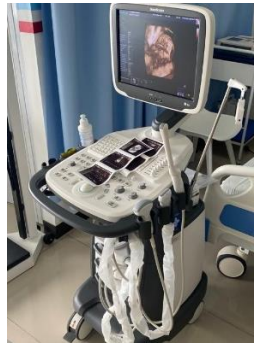
Ilustración 21 – Instalación de un ultrasonido

Se realizó la instalación de ultrasonido modelo s12 marca Sonoscape, al cual se le realizó las configuraciones necesarias para los requerimientos del cliente, de igual manera se le realizó la instalación de una impresora marca Sony, se realizó la configuración de forma digital el cliente no quería análoga y también se debó la opción de conectar la pantalla a un televisor cercano, por último, se hizo la capacitación al personal.