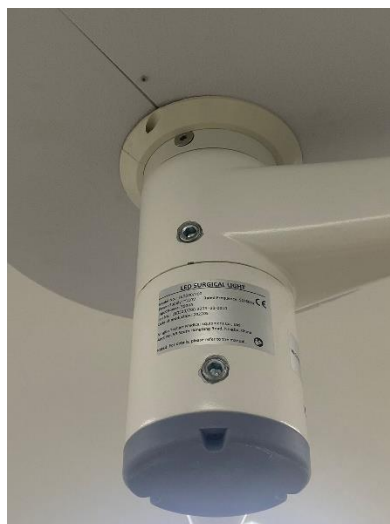
Ilustración 4 – Visualización de los frenos de la lampara cielítica.

Se realizó mantenimiento correctivo en un brazo de la lámpara cielítica en el progreso Yoro, la cual presentaba un desnivel en su base y desgaste de frenos en sus respectivos brazos. Se identificaron y abordaron con prontitud los problemas de desnivel en la base y el desgaste de los frenos en los brazos correspondientes.