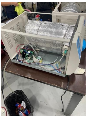
Ilustración 15 - Mantenimiento correctivo de autoclave.

Se llevó a cabo un mantenimiento correctivo a dos autoclaves de vapor de 200 lts, los cuales presentaban la misma falla, exactamente el error 7 que según el manual de servicio se debía a falla de presurización over time, al darle una revisión minuciosa se observó que las resistencias presentaban fallas por lo cual se procedió a realizar el cambio de estas, y posteriormente se hicieron pruebas asegurándonos que quedaran funcional al 100%.