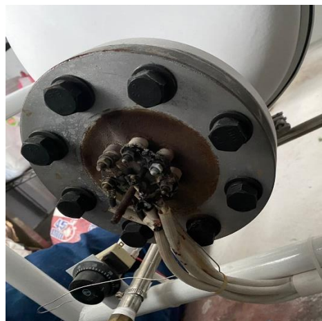
Ilustración 42 – Mantenimiento correctivo a autoclave de vapor

Se brindó mantenimiento correctivo a una autoclave que generó cortocircuito en su sistema de resistencia, el problema fue debido a falencias en requerimientos técnicos del área, ya que hay un exceso de humedad y generó corrosión en sus terminales provocando un fuerte cortocircuito, se hizo cambio de cableado y terminales para corregir la falla ocurrida.