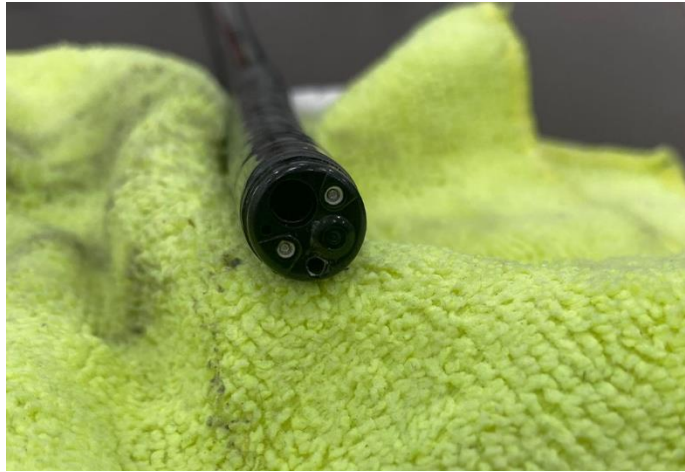
Ilustración 39 – Cambio de nozzler obstruido en punta distal de colonoscopio