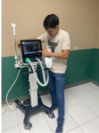
Ilustración 14 – Demostración de ventilador comen V5

Se llevó a cabo la demostración de un ventilador mecánico marca comen modelos V5 en el hospital Mercy Medical Center de la ciudad de la ceiba. Durante la presentación, se destacaron las características clave y el rendimiento destacado del equipo ante las autoridades hospitalarias pertinentes. La participación en el proceso de licitación fue exitosa, con una destacada victoria en la competencia contra otras empresas del sector, asegurando así la adquisición y la confianza en la calidad y eficacia del producto ofrecido.