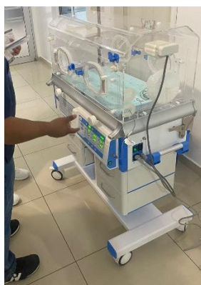
Ilustración 28 – Instalación incubadora cerrada

Se realizó la instalación de una incubadora cerrada, una lampara de fototerapia y un equipo de oxigenoterapia de alto flujo en clínicas medicas copan, se realizaron pruebas para corroborar su buen estado y se brindó capacitación a los usuarios para asegurarnos un buen uso y evitar errores de usuarios.