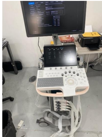
Ilustración 16 - Mantenimiento preventivo de ultrasonido.

Se llevó a cabo revisión e inspección de ultrasonido Sonoscape P60 que ingreso a bodega luego de una demostración que se realizó y que se prestó el equipo, se le hicieron pruebas a cada sonda el cual eran 3, lineal, convexo y volumétrico, constatando el correcto funcionamiento de cada uno de ellos, luego se procedió a darle mantenimiento preventivo y limpieza general al equipo para hacer el traslado al departamento de logística.