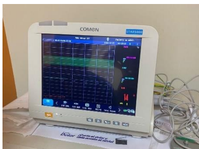
Ilustración 36 – Instalación y capacitación de monitor fetal

Se realizó la instalación de un monitor fetal dejando colocado todos sus sensores y papel para impresión, se realizaron pruebas de funcionamiento para asegurarnos su óptimo estado de funcionamiento, de igual manera se brindó capacitación al personal médico encargado del equipo para que puedan usarlo de la mejor manera y evitando errores de usuario.