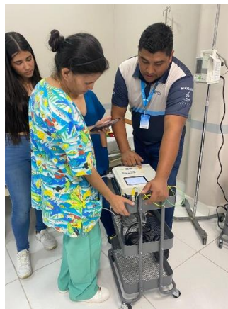
Ilustración 26 – Instalación de electrocardiógrafo y bomba de infusión

Se realizó la instalación de una bomba de infusión, un electrocardiógrafo y un monitor de signos vitales, se realizó la capacitación del personal a cargo del área para asegurarnos un buen uso del equipo y minimizando el riesgo de error de usuarios, se hicieron pruebas rigurosas para asegurar el funcionamiento óptimo de los equipos.