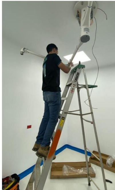
Ilustración 12 – Instalación lampara quirúrgica

satélites, se realizaron mediciones de voltaje para asegurar que llegara el voltaje correcto, por último, se hicieron pruebas de funcionamiento y capacitación del personal a cargo del área.