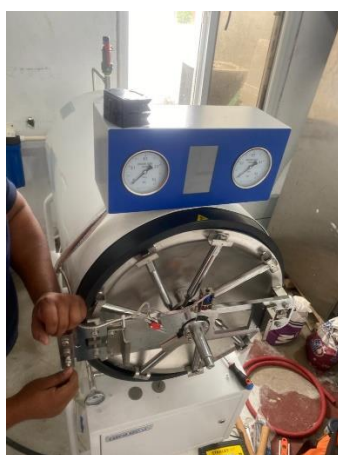
Ilustración 6 – Instalación de autoclave a vapor.

Se realizó la instalación de una autoclave a vapor marca BIOBASE en el Hospital la fe en la ciudad de La Ceiba Atlántida, de igual manera se hicieron pruebas correspondientes del correcto funcionamiento del equipo, y al final se le brindó capacitación al personal de la CEYE para su correcto uso y su disminución de errores de usuarios y previniendo posibles lesiones por un mal uso.