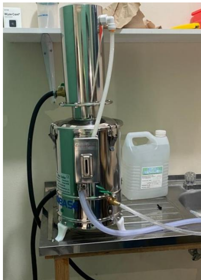
Ilustración 11 – Instalación de un destilador de agua

Se realizó la instalación de un destilador de agua en la ciudad de Gracias en Laboratorio Clínico Díaz, se instaló un tomacorriente de 220 y se procedió a conectar el equipo luego se procedió a hacer pruebas de funcionamiento para asegurar su correcto funcionamiento y por último se realizó capacitación al personal que está a cargo del equipo para prevenir errores de usuario.