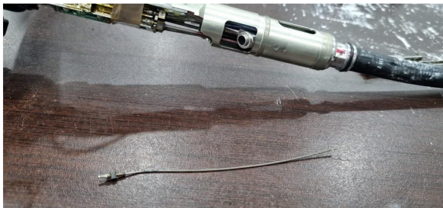
Ilustración 38 – Rienda del bending del colonoscopio reventado