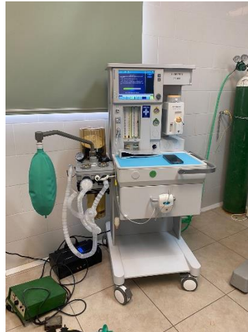
Ilustración 30 – Instalación de máquina de anestesia

Se realizó la instalación de una máquina de anestesia comen modelo AX-500, se realizaron pruebas para corroborar su buen estado y se brindó la capacitación a los usuarios para asegurarnos un buen uso y minimizar el riesgo de errores, se realizaron todas las calibraciones necesarias del equipo para trabajar en perfectas condiciones.