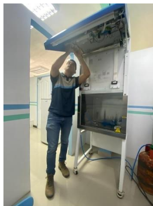
Ilustración 22 – Reparación de módulo de luz UV

Se realizó la reparación del módulo de luz uv de una cabina de bioseguridad, se hicieron pruebas de voltaje y se percató que el balastro no estaba en las mejores condiciones, se realizó el cambio del balastro de igual manera se hizo cambio a los portalámparas de la candela, y se colocó una nueva candela debido a que la que estaba presentaba señales de quemarse pronto, entonces se prefirió dejar una nueva y funcional.