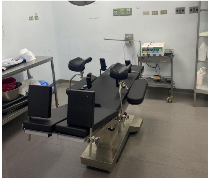
Ilustración 3 – Instalación mesa quirúrgica.