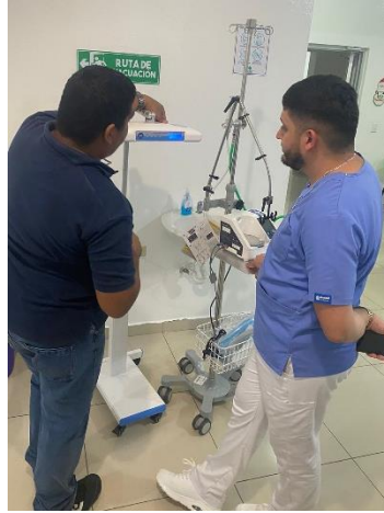
Ilustración 29 – Instalación de lámpara fototerapia y oxigenoterapia de alto flujo