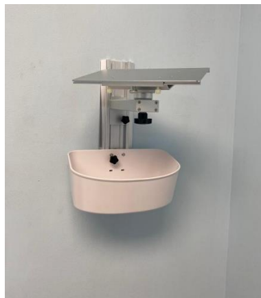
Ilustración 17 – Instalación soportes de pared para monitores

Se llevó a cabo la instalación de 10 soportes para monitores de signos vitales, estos se armaron y se le hicieron adaptaciones ya que el hospital solicitante tenía diversos monitores no compatibles con los soportes, al adaptarlos se posibilito el uso seguro y óptimo de estos dispositivos para brindar una atención de calidad a los pacientes de la unidad de cuidados intensivos y la unidad de recuperación del centro médico Lancetilla.