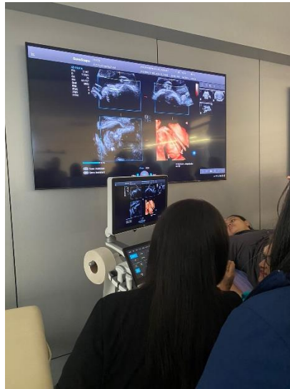
Ilustración 5 – Capacitación Sonoscape ultrasonido P60.

Latinoamérica. A través de esta capacitación de alto nivel, se adquirió un profundo conocimiento de las últimas innovaciones y prácticas destacadas en el campo de la tecnología médica, con un enfoque específico en los productos y soluciones ofrecidos por Sonoscape. El cual consta con inteligencia artificial.