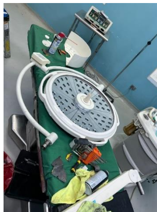
Ilustración 19 – Desmontaje de lámpara quirúrgica para mantenimiento correctivo.

Se realizó mantenimiento correctivo a una lámpara quirúrgica que presentaba fallas, el satélite de 700 se apagaba al hacer su movimiento giratorio, se desarmó y se percató que el aire acondicionado condensaba el aire y presentaba humedad hacia el equipo, el cual presentaba corrosión masiva dentro de su mecanismo, los carbones estaban en mal estado y las balineras en estado crítico por el óxido, se procedió a desmontar el equipo y hacer cambio de todos los componentes en mal estado, se recomendó al hospital a no hacer uso de mini Split en quirófano y tratar de hacer una estación de aire centralizada por ducto.