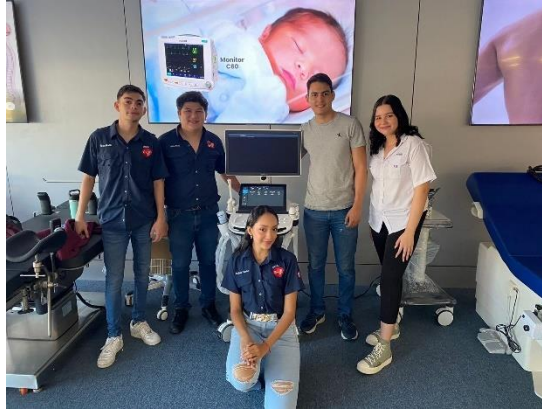
Ilustración 35 – Taller Sobre IA en Ultrasonido

Se brindó un taller a los estudiantes de Unitec sobre la inteligencia artificial en los ultrasonidos sonoscape, el principio de funcionamiento de este equipo y como realizarle el mantenimiento preventivo al equipo, también se les explicó cómo usarlo y los tipos de modo, se les dio un tour y enseñándoles todos los equipos distribuidos por IMECSA, se les enseñó a armar una máquina de anestesia y el principio de funcionamiento del equipo así como cada pieza, y se les brindó consejos sobre cómo abordar el mundo laboral.