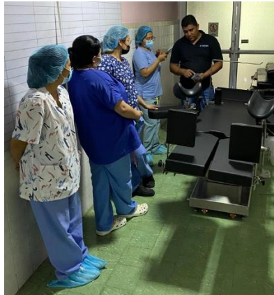
Ilustración 25 – Instalación de mesas quirúrgicas

cumplimiento de los estándares de calidad, asegurando así que el equipo estuviera plenamente operativo y en condiciones óptimas para atender las necesidades clínicas de manera eficiente y segura.