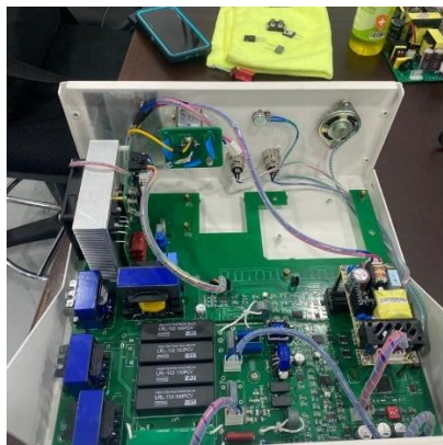
Ilustración 20 – Reparación de electrocauterio

Se realizó mantenimiento correctivo a un electrocauterio que presentaba fallas en general la potencia requerida para realizar los cortes y coagulación de la buena forma, se hicieron mediciones de voltaje y se demostró la falla en la tarjeta de generación de alto voltaje y alta frecuencia, se comunicó con fábrica y dieron las indicaciones para realizar el cambio de unos transistores mosfet y transistores y diodo rectificador.