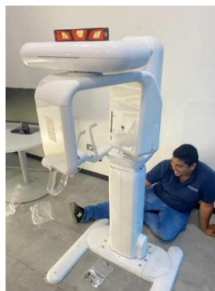
Ilustración 13 – Instalación de rayos x

Se llevó a cabo la instalación exitosa de un avanzado sistema de rayos X panorámico dental, el modelo Papaya Plus, en las instalaciones de la oficina de ventas de la empresa. Se realizaron pruebas exhaustivas para garantizar su funcionamiento óptimo, seguidas de una conexión en red con la computadora designada, encargada de digitalizar las imágenes obtenidas durante el proceso. Este enfoque aseguró una integración perfecta del equipo, permitiendo una captura eficiente y precisa de imágenes radiográficas, fundamentales para los procesos de diagnóstico y tratamiento en odontología.