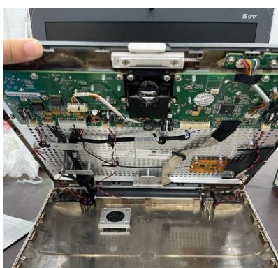
Ilustración 24 – Mantenimiento correctivo a S9V

Se realizó mantenimiento correctivo a un ultrasonido Sonoscape modelo s9V, el cual presentaba problemas en su disco duro, el equipo enciende, pero su disco duro no arrancaba por lo cual se apagaba o su pantalla se ponía en negro, se le realizó mantenimiento correctivo ya que sus componentes electrónicos estaban llenos de pelo y polvo, se le brindó limpieza al disco duro, el equipo trabajaba de buena manera.