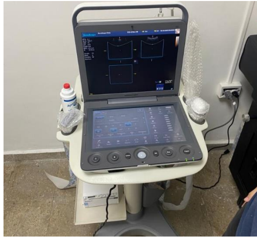
Ilustración 9 – Instalación de ultrasonido S9.

cliente, permitiéndoles familiarizarse plenamente con las capacidades y funciones avanzadas del equipo. Además, se llevó a cabo la instalación meticulosa de la impresora asociada, asegurando su conectividad a la red para una eficiente transferencia de datos.