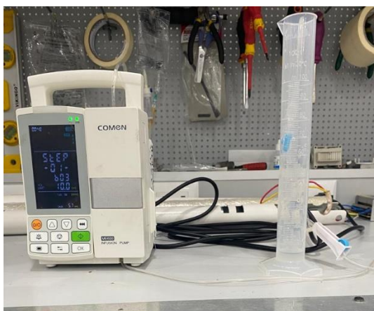
Ilustración 7- Calibración de bombas de infusión.

Posteriormente, se realizaron pruebas integrales de funcionamiento para verificar con certeza su desempeño y garantizar que cumplieran con los estándares de seguridad y precisión requeridos en entornos clínicos exigentes, marcado por el fabricante el cual es del \pm 3\% .