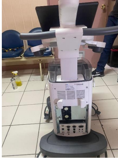
Ilustración 31 – Mantenimiento preventivo ultrasonido P9