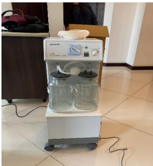
Ilustración 40 – Instalación y capacitación de un succionador.

Se realizó la instalación de un succionador transportable con todos sus accesorios incluido el pedal, también se capacito al personal médico haciendo pruebas de verificación para asegurarnos el correcto funcionamiento del equipo, asesorándonos un excelente servicio al cliente.