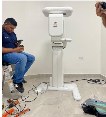
Ilustración 41 – Instalación y capacitación de rayos x panorámica dental.

seguidas de una conexión en red con la computadora designada, encargada de mostrar las imágenes obtenidas durante el proceso. De igual manera se hizo la conexión por red a la impresora que será la encargada de imprimir las imágenes obtenidas.