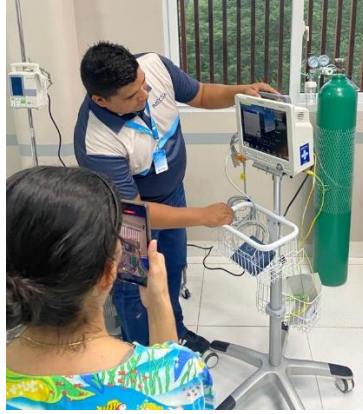
Ilustración 27 – Instalación y capacitación de monitor de signos vitales