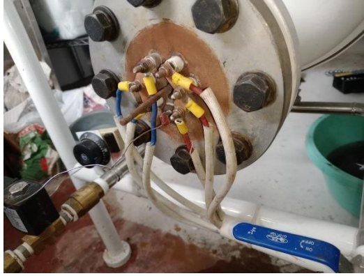
Ilustración 43 – Cambio de terminales y cableado de autoclave