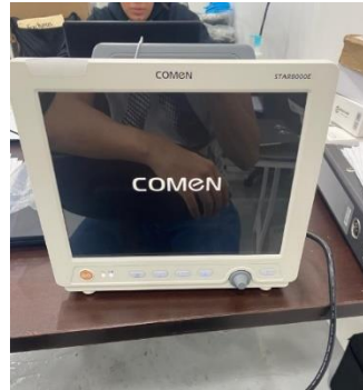
Ilustración 18 – Revisión de monitor de signos vitales

Se realizó una exhaustiva inspección del reciente lote de monitores de signos vitales que ingresó a la empresa, llevando a cabo un meticuloso proceso de revisión de cada sensor incluido en la adquisición. Se emplearon analizadores especializados para verificar la precisión y funcionalidad óptima de cada sensor. Posteriormente, se completó una detallada ficha de trabajo que documentaba el estado óptimo de cada equipo, la cual fue entregada al departamento de logística para su registro y seguimiento correspondiente.