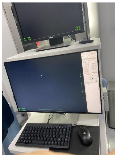
Ilustración 34 – Software Arco en C

Se brindó apoyo al personal técnico durante una cirugía de rodilla en Porsalud por cualquier duda o emergencia durante esta etapa, se capacito sobre el uso del software para mejorar la imagen con el procesamiento de esta.