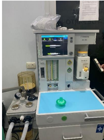
Ilustración 33 – Instalación máquina de anestesia Comen AX-500

Se realizó la instalación de una máquina de anestesia comen modelo AX-500, se realizaron pruebas para corroborar su buen estado y se brindó la capacitación a los usuarios para asegurarnos un buen uso y minimizar el riesgo de errores, se realizaron todas las calibraciones necesarias del equipo para trabajar en perfectas condiciones.